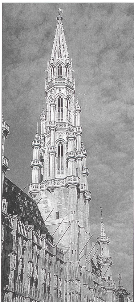
Das Rathaus am Marktplatz in Brüssel.

Nach diesem ganz besonderen Essen wurden wir durch die Stiftskirche St. Gertrud geführt, eine eindruckliche Besichtigung dieser Kirche aus dem 7. Jahrhundert. Den Namen führt sie nach der ersten Äbtissin dieses Doppelklosters, welches von Iduberga von Aquitanien, Gertruds Mutter, um 650, nach dem Tod ihres Gatten, Pippins des Älteren, gegründet wurde. Von der ersten Äbtissin über die anfängliche Gemeinschaft des Doppelklosters über das Kapitulum bis zur Restaurierung der