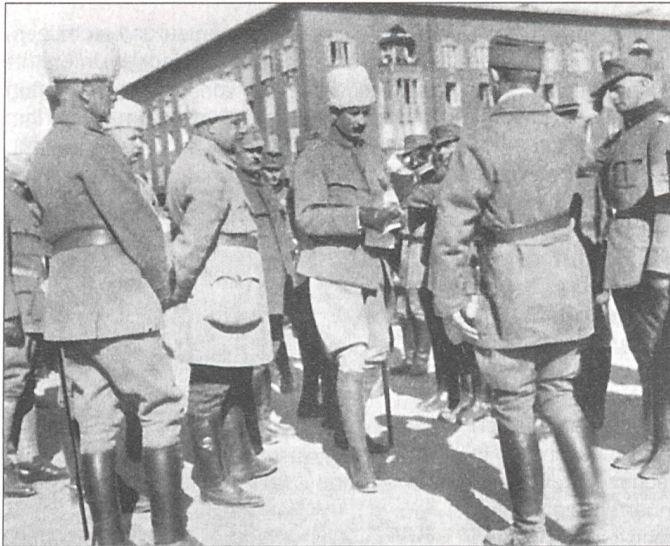
Die Regierung Paasikivi macht Präsident Mannerheim im November 1944 ihre Aufwartung.

eine deutsche Infanteriedivision zugewiesen, der für die Nordfront Finnlands das deutsche Gebirgskorps Norwegen und das deutsche XXXVI AK nachgeschoben wurden. In Mittel- und Südfinnland gingen im Sommer 1941 fünf finnische AK zum Angriff über, um die von Russland besetzten Ostgebiete zurückzuerobern. Ostkarelien wurde bis zum Westufer des Onegasees und im Süden bis zum Fluss Svir besetzt. Beim Jahreswechsel 1941/42 geriet Finnland in eine Krise, weil Hitler versuchte, Finnland zu einem Vorstoss über die alten finnischen Ostgrenzen hinaus und hinein nach Russland zu drängen. Mannerheim widerstand diesen Bemühungen, wohl wissend, dass er dabei ein grosses Wagnis einging. Gleichzeitig muss er auf diplomatischem Weg verhindern, dass die Alliierten Finnland den Krieg erklärten.