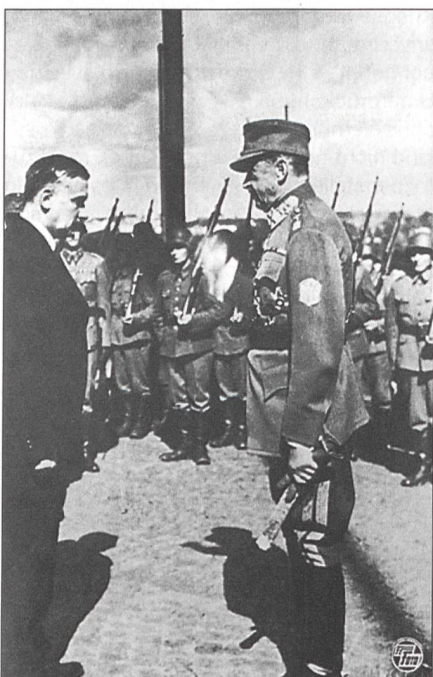
Oberbefehlshaber Mannerheim verleiht nach der Einnahme von Wiborg den Offizieren das Freiheitskreuz.

Bereits am 8. Januar 1918 erklärte Lenin seine Zustimmung, davon ausgehend, dass die proletarischen Kräfte die bürgerliche Vormacht stürzen und Finnland mit dem russischen Zukunftsstaat vereinen würden. Zudem standen in Finnland an allen strategisch wichtigen Stellen über das ganze Land verteilt 29 russische