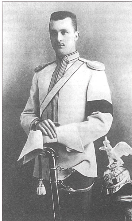
Mannerheim als Chevalier-Gardeleutnant im Dienste des Zaren.

Nach der Grundausbildung im finnischen Kadettenkorps und dem Abitur absolvierte Mannerheim die Nikolai-Kavallerieschule in St. Petersburg. Nach zweijährigem Dienst bei den Schwarzen Dragonern in Kalisz in Westpolen gelang ihm der Eintritt