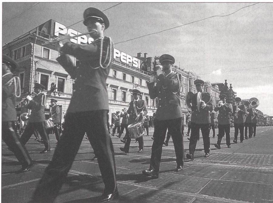
Parade durch St. Petersburg des Repräsentationsorchesters Schweizer Armeespiel.

Seit diesem Jahr wird die musikalische Qualität auch optisch durch die neuen