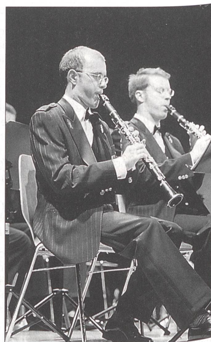
Symphonisches Blasorchester Schweizer Armeespiel: Für Auftritte in Konzerthäusern trägt dieses Orchester schwarze Galauniformen.

Galauniformen unterstützt. Abgeleitet von der Schweizer Fahne setzt auch das Schweizer Armeespiel auf die Farbe Rot mit den Kontrastfarben Weiss und Schwarz. Das Repräsentationsorchester, welches seinen Einsatz zum Grossteil an Rasen-