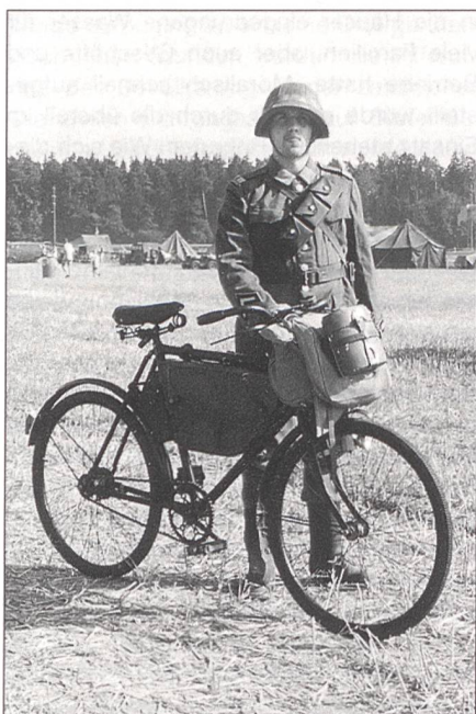
Für viel Aufsehen sorgte dieses Duo. In der schwülen Hitze brachten Stahlross und Radfahrer die Convoy-Strecke in 117 Minuten hinter sich.

gelände. Dem grossen Teilnehmeraufmarsch aus ganz Europa begegnete das OK unter Adrian Gerwer mit einem gegenüber 1996 deutlich grösseren Veranstaltungsareal. Auf 7 Hektaren konnte der Besucher endlos alte Fahrzeuge militärischer Herkunft besichtigen. Manche der Veteranen hatten schon in verschiedenen Armeen gedient, wie jene Dodges und GMCs, die ursprünglich unter dem Sternbanner ihre Einsätze fuhren, um später als Surplusware an die Schweizer Armee überzugehen. Alle erdenklichen Varianten des «General Purpose», vulgo «Jeep», waren vertreten. Aber auch die zahllosen