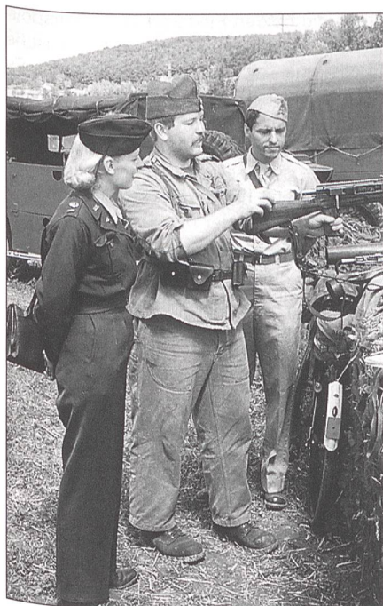
Ein Bild wie um 1945: Gäste von der US Air Force lassen sich von einem Füsilier des Inf Bat 97 die Handhabung des Lmg 25 erklären.

In der Nähe des Turmes waren am Checkpoint rund um die Uhr die Security-Leute von Markus Fischer im Einsatz. Dieser Truppe muss ein grosser Kranz gewunden werden. Offensichtlich durch Unachtsamkeiten des OKs erweiterte sich das Aufgabengebiet der Sicherheitsleute beständig bis an die Grenze des Erträglichen. Stundenlanges Dienst in sengender Sonne war die Norm. Zu den ohnehin heiklen Sicherheitsaufgaben auf dem Ausstellungsgelände gesellten sich Tätigkeiten als Festzeltportiers, Parkplatzaufseher und Kiosklieferanten. Auch patrouillierten sie in der Nacht zum Samstag, nass bis auf die Knochen, durch das Camp, um sich zu verge-