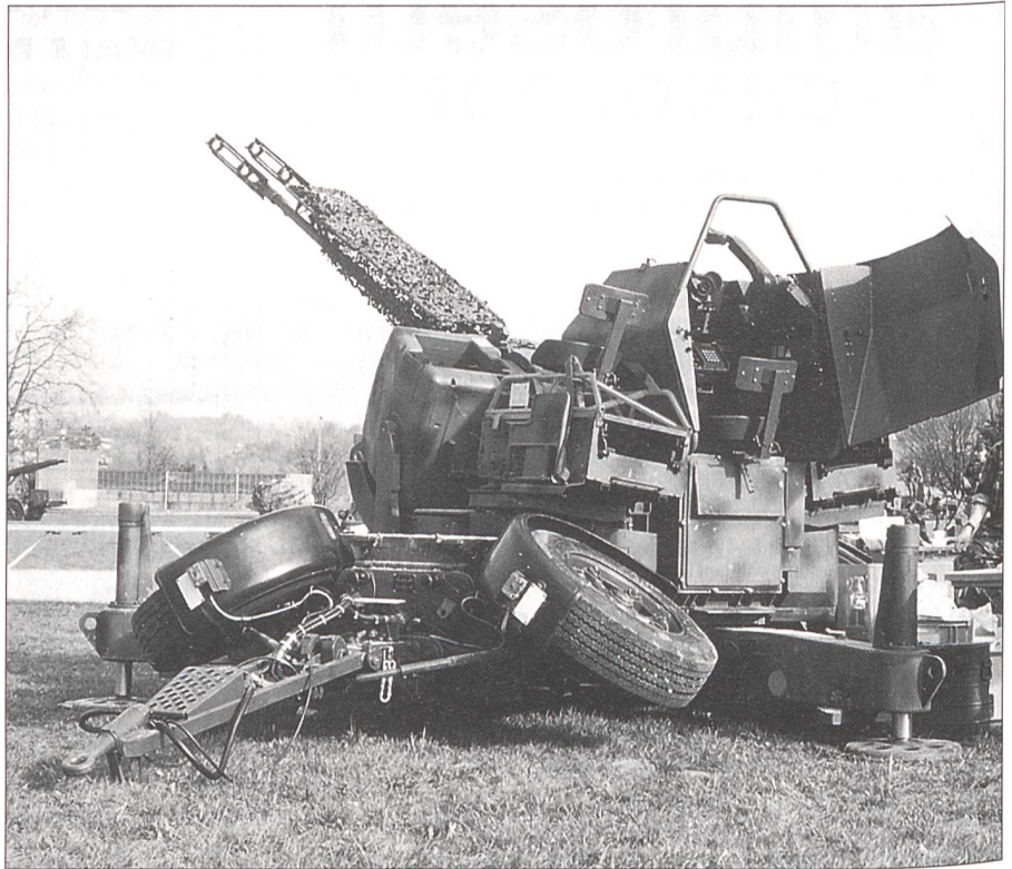
35-mm-Flab-Kanone, vollautomatisches Zwillingsgeschütz mit 4000 m Wirkungsdistanz und total 7700 kg Gewicht.