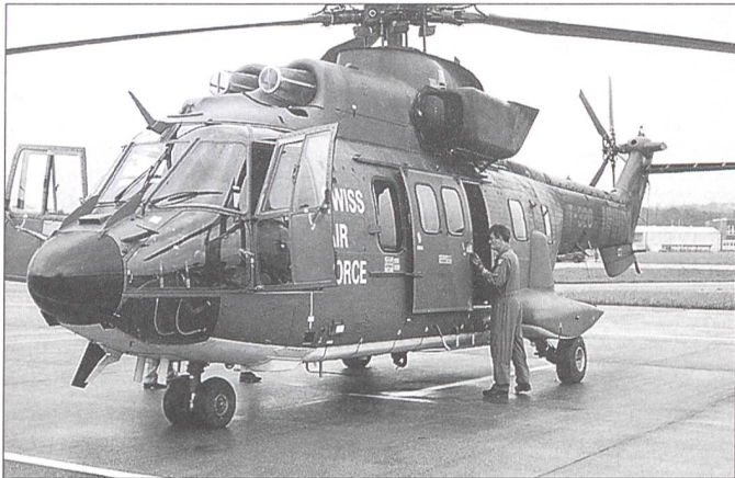
Kosovo-Veteran und Lufttaxi für Medienvertreter; Stationen eines Superpumas.