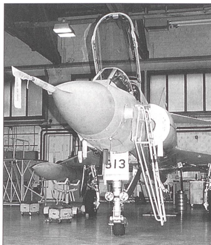
Wohl einer der letzten Auftritte einer alten Dame. Die Mirage als Wettkampfobjekt beim Tankwechsel.

Im Anschluss an die Besichtigungstour referierte Divisionär Hansruedi Fehrlin vor einer illustren Gästeschar im Filmsaal der Kaserne Emmen über die Bedeutung der Meisterschaften für die Luftwaffe. Eingangs jedoch bestellte er Grüsse von Korpskommandant Carrel, der leider nicht wie geplant persönlich erscheinen konnte, um einen Vortrag zu halten. Fehrlin wies auf jene Fragen hin, welche die Armee angesichts eines immer grösseren Spardrucks zu lösen habe. Gerade die diffizile Ausbildung bei der Luftwaffe sei nicht gänzlich im kostengünstigen Simulator absolvierbar. Auch unterstrich er den Balkaneinsatz, der offenbar nötig schien, um den Sinn einer stets bereiten Luftwaffe zu demonstrieren. Als Gemeindepräsident von