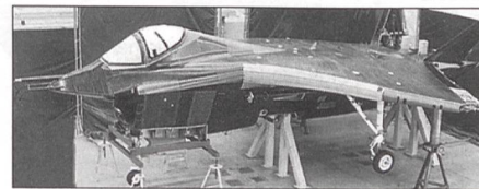
Montage des ersten Boeing X-32.

Ein Konsortium um Boeing bewirbt sich gegen Lockheed Martin um den Auftrag zum Joint Strike Fighter. Der erste Prototyp des Erprobungsträgers Boeing X-32 wird gegenwärtig in Palmdale montiert.