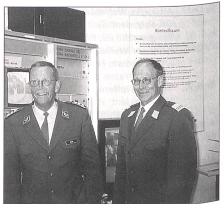
Ulrich Hess, Korpskommandant und Chef «Interet FAK 4», und Oberst Adolf Gucker, Gemeindepräsident, Erlenbach, beim Foto-termin im Kontrollraum.

Die Wirtschaft und die Industrie interessiert es, wie die Dienstpflicht der Armee XXI geleistet werden soll. Hess: «Meine persönliche Idealvorstellung sieht so aus: Der Dienst wird grundsätzlich am Stück geleistet.» Es sei aber denkbar, dass nach einer stark verlängerten Grundausbildung anschliessend noch einige wenige Übungsdienste (WK) im Jahresrhythmus angehängt werden. Somit könne der nun dienstfreie AdA noch vor seinem 30. Altersjahr in die berufliche Karriere einsteigen. Eine klare Abgrenzung zwischen Armee und Bevölkerungsschutz wird angestrebt. Die heutige Zweikomponenten-Armee gehöre bald der Vergangenheit an. Für den Gastreferenten Hans Hess, Chief Executive Officer der Leica Geosystem AG, Kommandant des Infanterieregiments 27, sind Wiederholungskurse nach heutigem System problematisch. Hess ist aus staatspolitischen Gründen für die Beibehaltung des Milizarmee, plädierte aber für den Dienst am Stück und für die Abschaffung der Wiederholungskurse. Oberst Hess ist für ein rascheres Beförderungssystem, das die Möglichkeit bietet, die Milizkarriere mit 30 Jahren als Bataillonskommandant zu beenden. «Damit hat