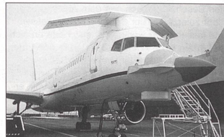
Boeing-eigenes Testflugzeug Boeing 757 mit der Elektronikausrüstung der F-22A Raptor.

Das gesamte Projekt Boeing F-22 Raptor (Nachfolger der McDonnell Douglas F-15 Eagle) ist seiner geschätzten Kosten wegen unter starkem Druck.