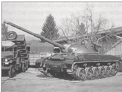
Ganz oben in der Gunst des Publikums: der Panzer P-61.

Begünstigt durch das aussergewöhnlich schöne Herbstwetter, fanden sich die Fahrzeuge aus allen Himmelsrichtungen der Schweiz in Schwarzhäusern ein. Als Prunkstück war dieses Jahr ein