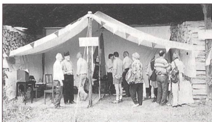
Andrang im Werbebüro.

Ein Höhepunkt des Samstags war die festliche Begrüssung der dampfgezogenen Jubiläumzüge durch die böllernden Artilleristen und die anschliessende Feier mit Taufe einer modernen