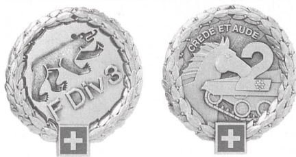
14. Schiess-Wettkämpfe der Felddivision 3 und der Panzerbrigade 2