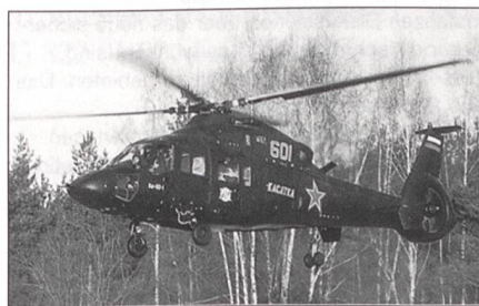
Kamov KA-60 Kasatka

Als Nachfolger des Mil Mi-8-Hip wurde die Kamov KA-60 Kasatka (Killerwal) entwickelt; allerdings fehlt gegenwärtig das Geld für die Serienfabrikation.