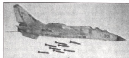
Xian JH-7 bei Abwurftests.

Seit etwa 1975 wird bei Xian der schwere Jagdbomber JH-7, Exportbezeichnung FBC-1 Flying Leopard, entwickelt.