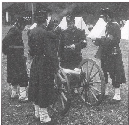
Gebirgskanone Ordonnanz 1845 im Einsatz.

mit der Zürcher Museumsbahn hat sie ein nostalgisches Jubiläumsfest unter dem Motto «Dampf & Rauch» veranstaltet.