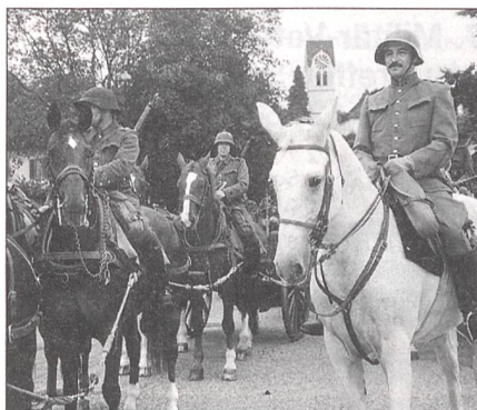
Das «letzte Defilee» der Pferdefreunde anlässlich der letzten Inspektion weckt Erinnerungen an eine Zeit, in der die «Habermotoren» für die Armee unentbehrlich waren.

wart und den laufenden Armeehalbiierungs- und -abschaffungsinitiativen.