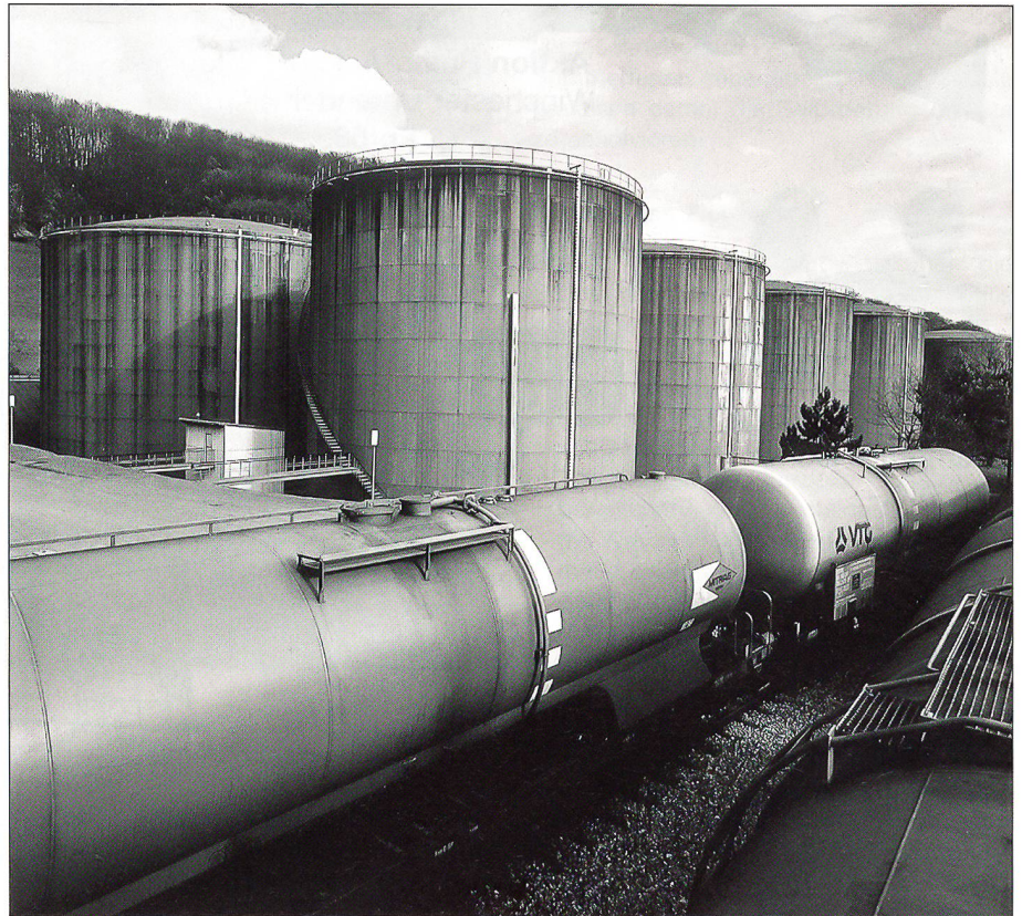
Als Mitglied der Internationalen Energie-Agentur ist auch die Schweiz verpflichtet, Erdölvorräte anzulegen.

kontinuierlich auszubauen sei, da sich die Schweiz nicht mehr im Alleingang gegen die möglichen Gefahren absichern kann. In die gleiche Richtung zielt auch der Delegierte der wirtschaftlichen Landesver-