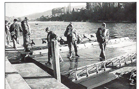
Der Brückeneinbau zog viele Interessierte an.