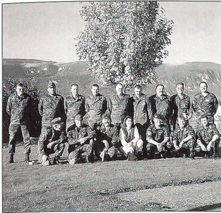
Gruppenfoto der erstmals am Jupal teilnehmenden Deutschen Reservistenkameradschaft aus Heilbronn zusammen mit einigen Schweizer OK-Mitgliedern (rechts aussen).

Als neue Disziplinen wurden Inline-Skate und Bike in den Wettkampf integriert. Daneben galt es die üblichen Disziplinen, wie ACSD, Pz- und Flz-Erkennung, Militärwissen, Stgw- und Pist-Schiessen, HG-Werfen, Linien-OL und Überraschungsposten zu bewältigen.