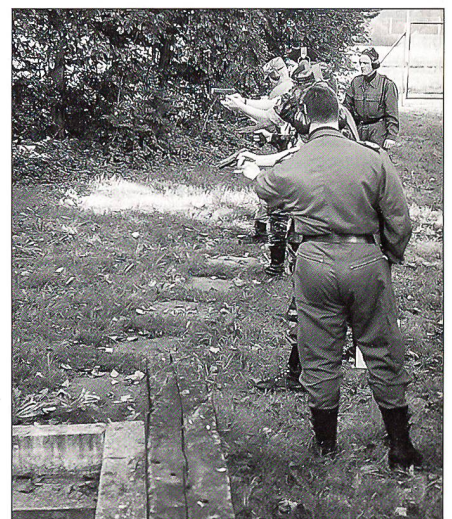
Bestens geführt und überwacht durch die Schiessinstruktoren der Stadtpolizei Zug sind die UOV-Mitglieder im Einsatz beim Combatschiessen.

Da der moderne Zweikampf mit Faustfeuerwaffe sich nur noch im Distanzbereich von wenigen Metern abspielt, sah der zu absolvierende Par-