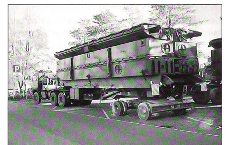
Ein einzelnes verladenes 10 Meter langes und 11 Tonnen schweres Modul.

Das Kommando des Pont Bat 28 hatte am letzten Mittwochabend im Oktober die Bevölkerung zum «Abend der offenen Brücke» eingeladen. In diesem Bataillon leisten mehrheitlich Angehörige aus Schaffhausen, dem St. Galler Rheintal sowie entlang der Zürcher Gewässer ihren Dienst. Sie alle wurden auf die alte Pontonbrücke «Schlauchbootbrücke 61» ausgebildet. Die Schweizer Armee hat vor einigen Jahren das französische Produkt «Schwimmbrücke 95» neu angeschafft, welche seit 1997 die Schlauchbootbrücke 61 ersetzt. Sie verfügt über eine Belastbarkeit von 63,5 Tonnen. Die erste Kompanie vom Pont Bat 28 hat den Anfang Oktober begonnenen Umschulungs-Wiederholungskurs im Raum Brugg auf die neue Brücke beendet, führte Adjutant und Armeeinstruktor Marco Pezotti aus, welcher für die Umschulung der Truppe zuständig war. Als Abschlussübung wurde sie auf dem Rhein vorgeführt und oberhalb der Schiffswerft in Rekordzeit eingebaut. Die anderen Kompanien werden gestaffelt mit je einer Woche Verschiebung ebenfalls noch umgeschult.