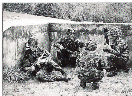
Mustergültige Befehlsausgabe in Deckung durch den Gruppenführer vor dem Gefechts-einsatz.