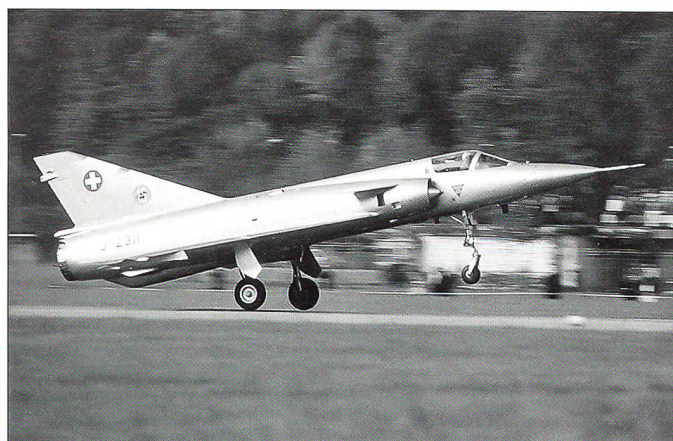
Start der goldenen Mirage III S J-2311 mit Pilot Maj Paul Starkel.

Für den letzten grossen Auftritt der Mirage III S wurden am 22. Oktober 1999 auf dem Flugplatz Buochs ein gutes Dutzend der Deltaflügler in Reih und Glied für den