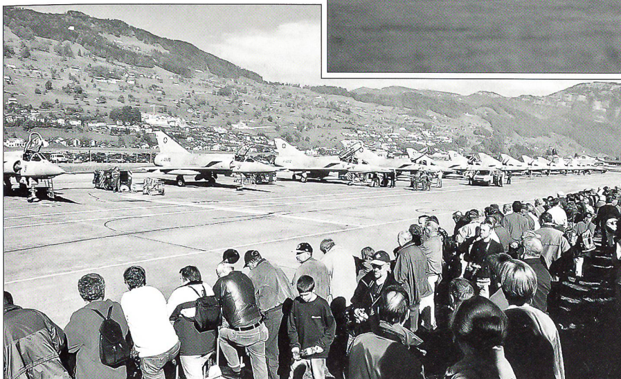
Die zahlreichen Besucher konnten die Mirage III S noch einmal in Reih und Glied sehen.