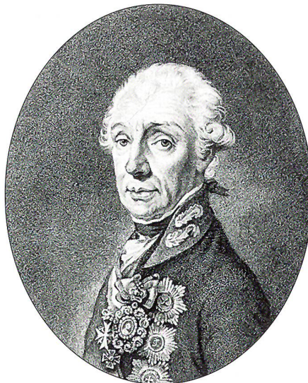
Alexander W. Suworow (1729–1800).

Suworow erreichte am 26. September Altdorf und merkte, dass er in einer Sackgasse steckte. Der alte Gotthardweg war damals in Flüelen zu Ende, und ein Weiterkommen war nur über den Urner See möglich. Weil die Franzosen alles schiffbare Material vernichtet oder mitgenommen hatten, setzte er seinen Marsch über den Kinzig-Kulm-Pass nach Muotathal fort. Doch die neue Lage zwang den General, auszuweichen und über den Prager Pass nach Osten ins Glarnerland zu stossen. Ein ungewöhnlich früher Wintereinbruch, fehlende Verpflegung, Mangel an Munition und die Erschöpfung der Truppe machten sich immer deutlicher bemerkbar. Trotzdem eroberte Suworow am 1. Oktober Glarus, versuchte aber vergeblich, an den Walensee zu stossen. Er musste über Elm und den Panixer Pass aus dem Glarnerland ins Bündnerland ausbrechen, um nicht den nachrückenden Franzosen in die Hände zu fallen. Am 10. Oktober erreichte er Chur. Etwa 15 000 Mann waren von den ursprünglich 21 000 übrig geblieben.