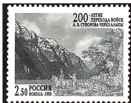
Gedenkmarken anlässlich des 200. Jahrestages der Alpenüberquerung Suworows.