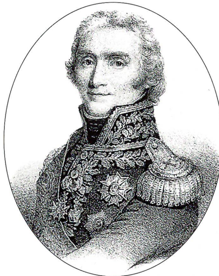
André Masséna (1758–1817)