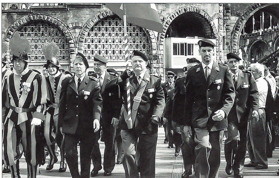
Schweizer Bürger in verschiedenen Uniformen, Teilnehmer Päpstliche Schweizergarde und Schweizer Armeeingehörige miteinander zu einem Anlass.

Als rein militärischer Anlass darf die Totenehrung der französischen Armee beim Soldatendenkmal in der Innenstadt bezeichnet werden. Jedes Land stellt zu diesem Anlass eine grössere Delegation mit der entsprechenden Landesfahne. Mit einem Marsch durch die Stadt wurde die Feier eingeleitet. Pünktlich um 18 Uhr erfolgte die Kranzniederlegung. Im Anschluss daran wurden die Delegationen durch die anwesenden Generäle und den französischen Militärbischof einzeln begrüsst. Mit dem geschlossenen Rückmarsch durch die Stadt fand diese Feier ihren Abschluss. Am Abend des zweiten Tages nahmen wir