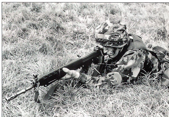
... als Einzelkämpfer,

Junge Leute gehen kritisch durchs Leben. Sie wollen wissen, warum sie was tun müssen. Das Kader ist aufgefordert, den Rekruten vermehrt den Sinn ihres Dienstes zu vermitteln. In einer Zeit, in der die Bedrohungslage schwierig zu verstehen ist, ist es vor allem auf einer allgemeinen Ebene erforderlich, dass die Rekruten einsehen, warum ihr Dienst notwendig ist. Aber auch im Alltag muss man ihnen beispielsweise erklären, warum die Zimmerordnung wichtig ist, warum sie die Manipulationen am Sturmgewehr drillmässig einüben müssen oder warum sie nach einer Nachtübung nur drei Stunden schlafen können und dann die Ausbildung am nächsten Tag normal weitergeht. Jeder Befehl muss einen Sinn haben. Vor allem zu Beginn der soldatischen Ausbildung ist es oft notwendig, diesen Sinn zu erklären. Nur so kann sichergestellt werden, dass die Soldaten zu einem späteren Zeitpunkt ihren Vorgesetzten vertrauen und die Aufträge auch dann pflichtbewusst erfüllen, wenn mit knapp gehaltenen Befehlen geführt werden muss. Das heisst, dass insbeson-