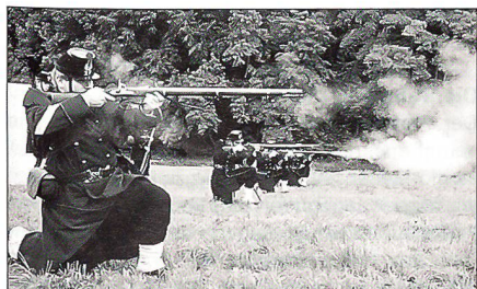
«NGST» anno 1861...

In den Statuten wird neben der Traditionspflege auch die Erhaltung historischer Ausrüstungsgegenstände, Waffen und Uniformen als Aufgabe genannt. Die eigene Dokumentationsstelle sammelt historische Bilder, Fotos, Reglemente, Memoiren, die Aufschluss über den Soldatenalltag unserer Vorfahren geben können. Der Rüstmeister ist für die historisch getreue Equipierung der uniformierten Mitglieder verantwortlich. Der Drüllmeister besorgt die Ausbildung der Mann-