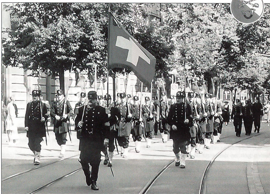
Marschgruppe auf der Zürcher Bahnhofstrasse.

schaft nach den Reglementen des vorletzten Jahrhunderts und der Schützenmeister besorgt die Ausbildung in der «NGST» von anno dazumal.