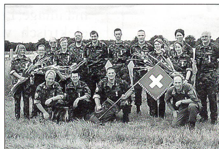
Stolz und ohne Ausfälle nach 160 km Marschstrecke präsentiert sich die Interlakner Gruppe mit den sechs blumengeschmückten Frauen am Ziel des Viertagemarsches 1999.

Das Aufkommen neuer Sportarten, überlagert mit dem Entscheid, dass nur noch in der Armee