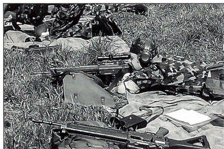
DACHS führt auch Spezialistenkurse durch (Stgw 90 mit Zielfernrohr)

Der Verein DACHS hat sich entschlossen, auch im Jahre 2000 für die Mitglieder des Schweiz. Unteroffiziersverbandes (SUOV) und der SOLOG ganztägige Ausbildungskurse in der Neuen Gefechts-schiesstechnik der Armee anzubieten. Für das Stgw 90 und die Pistole 75 werden jeweils