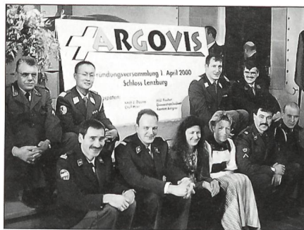
Der neue Vorstand vor der Gründungsurkunde, welche anschliessend durch alle Anwesenden unterzeichnet wurde.

Mit der Auflösung des Kantonalverbandes AUOV ging die Geschichte der Aargauer Unteroffiziere in keiner Art und Weise unter. Vielmehr soll der neue Verein mit seinem grossen Einzugsgebiet wieder Elan in die ausserdienstliche Tätigkeit der Unteroffiziere im Aargau bringen. Es hat von der