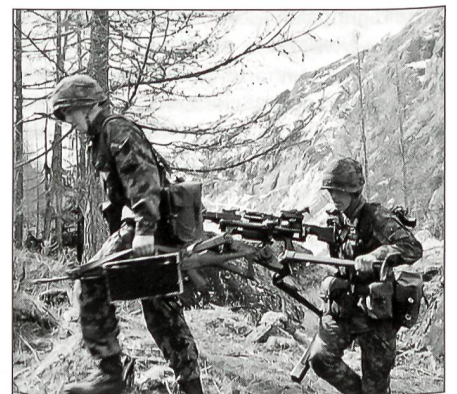
Gemäss KKV Einsatzdoktrin: Kommen ...

Im Zeitgeist unserer Gesellschaft rückt der Soldat mehr denn je ins Rampenlicht der Kritik. Besonders der Gebirgssoldat wird um sein Dasein in Frage gestellt. Selbst in militärischen Kreisen wird die Idee vertreten, dass der Kampf sicher nicht im Gebirge stattfinden wird. Morgarten 1315 und das Alpenreduit vom Zweiten Weltkrieg sind Geschichte. Dem Schweizer Militärgeschichtler Baron Antoine-Henri de Jomini (1779 bis 1869) kann nicht widersprochen werden, dass sich das Gebirgsgebirge für den entscheidenden, entschlossenen Verteidigungskampf besonders gut eigne. Die Zeiten haben geändert und das Kampfgeschehen mit ihnen. Auch die Schweizer