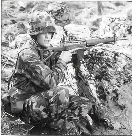
Der Gebirgsfüsiliergruppenführer im Einsatz.

Grenz- und Landesbefestigungen, die bereits in den ersten strategischen Plänen der seit 1815 aufgestellten Truppenkontingente enthalten sind, haben an Bedeutung verloren 9) .