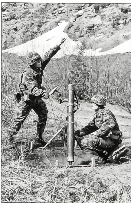
Erstellen der Minenwerfer-Schussbereitschaft.

Die Infanterie verfügt als Hauptgruppen-gattung über einen grossen Mannschaftsbestand. Jeder Infanterist erhält eine solide Grundausbildung an Waffen und Geräten sowie in der Gefechtstechnik bei Tag und bei Nacht. Bei der Infanterie gibt es über 20 Spezialausbildungsgebiete. Die Gebirgsinfanteristen erhalten zusätzlich eine Gebirgsausbildung der ersten Stufe, um in den Bergen, primär unterhalb der Waldgrenze, unter einfachen Verhältnissen zu haushalten, zu leben und zu kämpfen. Sekundär erstreckt sich die Aus-