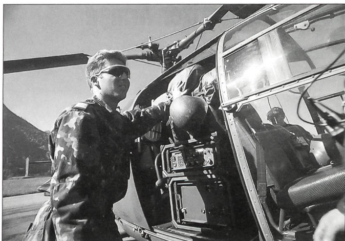
Auf in Bergeshöhen: Verlad einer Richt- strahlanlage in einen Helikopter.

in Anspruch nimmt. In unserer Brigade legen wir deswegen grösstes Gewicht auf massgeschneiderte Dienstleistungen. Wir wollen die richtige Person in der richtigen Funktion zur richtigen Zeit einsetzen. Dem Personalmanagement messen wir einen hohen Stellenwert zu. Gerade bei der Nachwuchsförderung des Kadets bemühen wir uns, Ausbildung und Dienstleistungen so festzulegen, dass wir den Bedürfnissen des Einzelnen möglichst entgegenkommen können. Jeder wird in seiner Funktion, in seinem Fach ausgebildet. Zusätzliches und bloss Wünschbares muss weggelassen werden. Als Gegenstück zu dieser Flexibilität fordern wir Kadets wie Mannschaft im Militärdienst entsprechend.