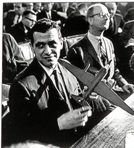
Pilot Francis Gary Powers während der Gerichtsverhandlung in Moskau.

Seit dem Beginn der U-2-Flüge am 4. Juli 1956 unternahmen die UdSSR alles, um die Eindringlinge abfangen zu können. Zahlreiche Boden-Luft-Raketen des Typs SA-1 wurden auf die Spionageflugzeuge abgefeuert. Doch ohne Erfolg. MiG-19-Abfangjäger stiegen auf, doch auch sie erreichten nicht die hoch fliegenden U-2. Um sie abfangen zu können, machten sich die Sowjets daran, bessere Waffensysteme zu entwickeln. Sie gingen zweigleisig vor: Aus der SA-1 entwickelten sie die SA-2 mit einer Dienstgipfelhöhe von 20 000 Metern, und auch der neue Abfangjäger Suchoi Su-9 sollte eine ähnliche Höhe erreichen. Als am 1. Mai 1960 Powers um 5.36 Uhr in den Luftraum der UdSSR einflog, ahnte er nichts. Zwar war die Entwicklung der SA-2 den USA bekannt, doch hofften die Einsatzplaner, die SA-2-Stellungen einfach umfliegen zu können. Als der Parteisekretär Chruschtschow über den weiteren Einflug einer U-2 orientiert wurde, war er ausser sich vor Wut. Er empfand diesen Flug als eine offene Provokation. Nur wenige Tage später – am 16. Mai – wollte er sich mit den USA, Grossbritannien und Frankreich in Paris zu Abrüstungsgesprächen treffen. Aber nun dieser Überflug. Chruschtschow befahl, die U-2 abzuschliessen. Alle Raketenstellungen und Luftwaffenstützpunkte entlang der Flugstrecke wurden alarmiert. Die abgefeuerten SA-1 sowie die aufgestiegenen MiG-19 blieben wieder erfolglos. Im Gegenteil: Im allge-