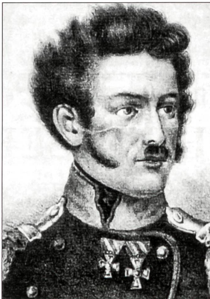
Der dem konservativen Lager angehörende Graubündner Oberst Johann Ulrich von Salis-Soglio wird – obwohl er Protestant ist – General des Sonderbunds (Stich).

am 18. März 1668 von der Tagsatzung beschlossen, brachte schliesslich eine umfassendere, allgemeine Wehrordnung. Das Defensionale erhöhte die Kontingente der Orte, setzte die Stärke der taktischen Einheiten fest und ordnete die Verpflegung und die Besoldung. Die Obrigkeit war im Felde durch einen Kriegsrat vertreten, zu welchem die Abgeordneten der Stände und die obersten Offiziere gehörten. Das Defensionale wurde im Laufe des 17. Jahrhunderts mehrfach abgeändert und ergänzt, ganz revidiert wurde es nie,