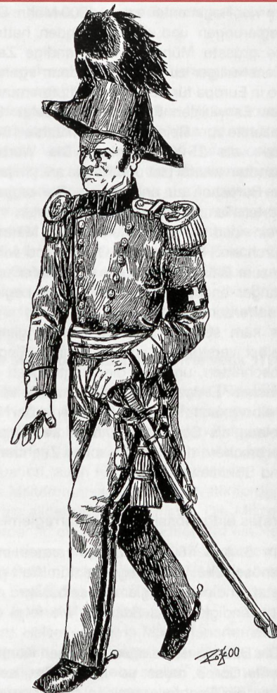
Oberst im Generalstab nach Ordonnanz 1852

europäischen Umfelds messen, auch wenn seine Truppen noch in vielen Bereichen hinter denen der Nachbarn herhinkten. Aber auch Rom wurde nicht an einem Tag erbaut.