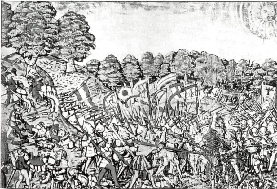
Schlacht bei Sempach (Luzerner Chronik des Diebold Schilling, 1513; Zentralbibliothek Luzern).