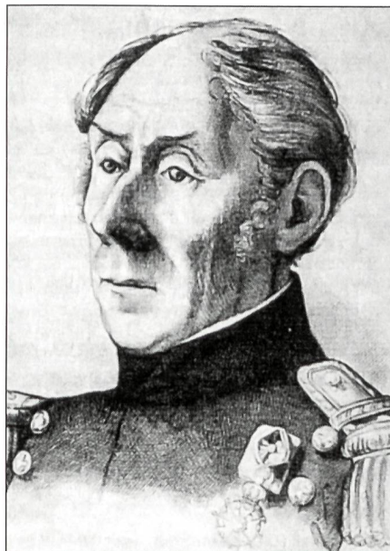
Der in Konstanz geborene Guillaume Henri Dufour, in Frankreich militärisch ausgebildet, wurde im Jahre 1831 zum eidgenössischen Generalstabschef befördert (Stich).

«Die Bildung des eidgenössischen Kontingents-Corps muss so beschaffen sein, dass die Nachteile, welche mit einem jeden Militär-Föderativ-System verbunden sind, so viel möglich gehoben oder wenigstens vermindert werden; daher alles, was auf Organisation, Oberkommando, Waffenübung, Disziplin, Dienst, Bewaffnung, Besoldung und Verpflegung der verschiedenen Kantons-Kontingente Bezug hat, nach einem völlig gleichförmigen Fusse eingerichtet werden soll.»