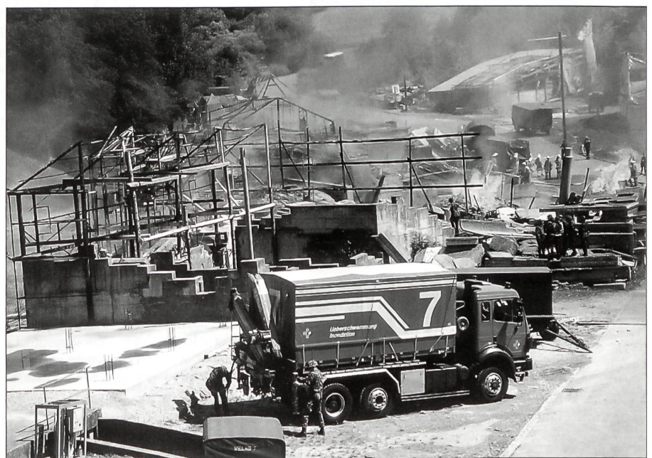
Truppeneinsatz im Rahmen der Existenzsicherung.

Ich habe bereits auf die Bedeutung der Partnerschaft zwischen Bund und Kantonen im Militärwesen hingewiesen. Mir scheint, dass die Mitwirkung der Kantone