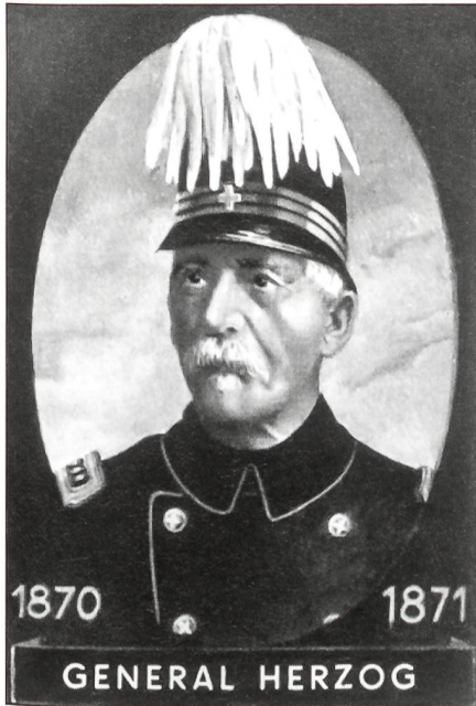
Grosse Persönlichkeiten wie zum Beispiel General Herzog forderten die Schaffung berufsmässiger Eliteverbände.

ruht auf den Säulen Föderalismus, Direkte Demokratie, Milizprinzip und Neutralität. Die Pflege dieses Verständnisses ist insbesondere im Militärwesen enorm wichtig, weil im Zusammenhang mit Sicherheitsfragen das Vertrauen zwischen Verantwortungsträgern einerseits und den Bürgerinnen und Bürgern andererseits entscheidend ist. Der Kanton ist besser in der Lage, die notwendige Transparenz und Bügernähe zu gewährleisten. So waren im letzten Jahrhundert föderalistische Überlegungen, das heisst die echte Sorge um die Erhaltung einer gewissen kantonalen Militärhoheit, die Entscheidungsgrundlage bei verschiedenen Volksabstimmungen.