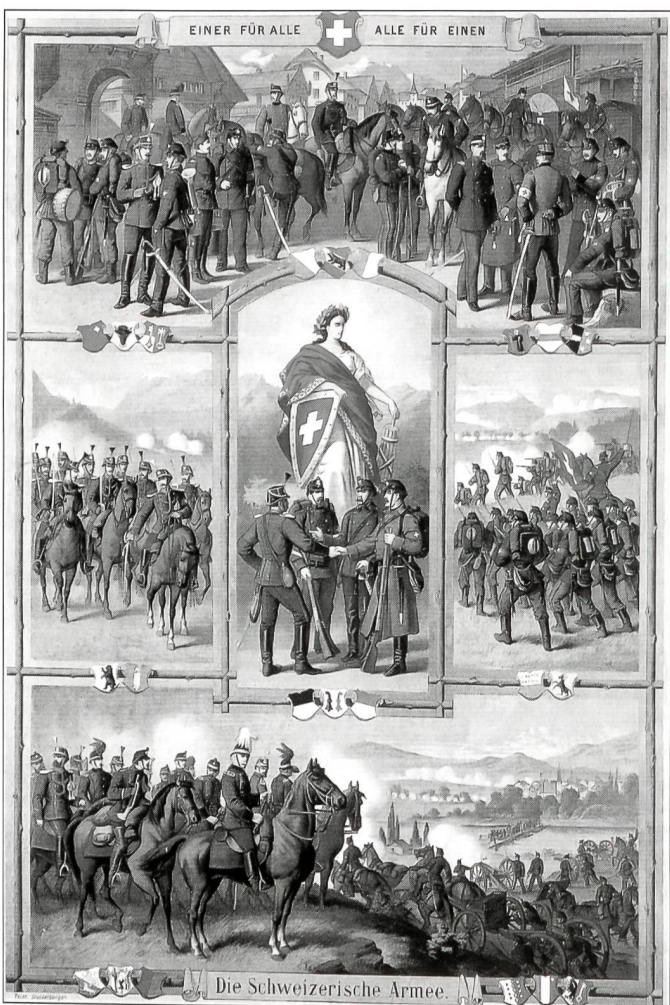
Wie keine andere Institution verkörperte die Armee das eidgenössische Gemeingefühl.