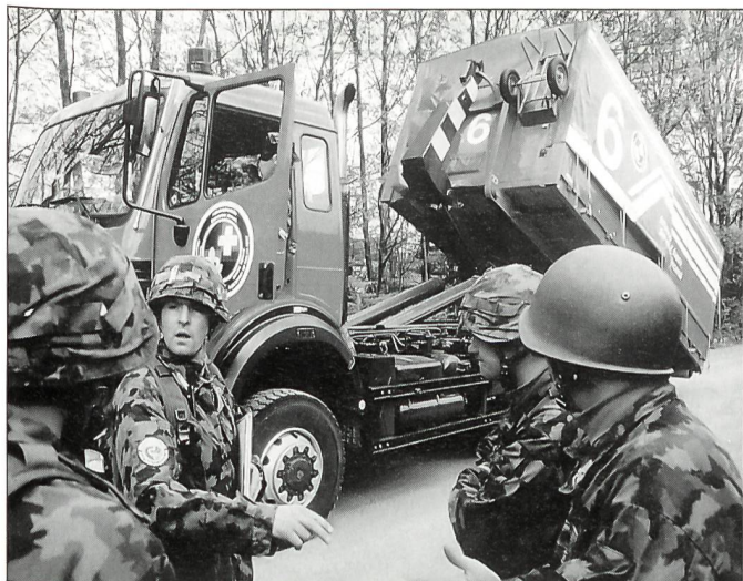
Gemeinsame Konfliktbewältigung stärkt das Vertrauen der Unterstellten in ihren Vorgesetzten.

in den Lösungsprozess einzubeziehen. Durch eine gemeinsame Problembewältigung wird die Autorität der Führungsperson in keiner Art und Weise untergraben. Im Gegenteil: Das Vertrauen der Unterstellten in ihren Vorgesetzten wächst, wenn sie sich verstanden und ernst genommen fühlen 5 . Es geht hier allerdings nicht – und das muss in aller Deutlichkeit festgehalten werden – um ein gemütliches Zusammensitzen und Plaudern, sondern um die Notwendigkeit, Konflikte durch den Meinungs-austausch aller Betroffenen zu lösen. Die Aufgabe der Führungsperson besteht dann darin, auch in komplizierten Situationen trotzdem zu entscheiden, zu handeln und die Verantwortung zu tragen.