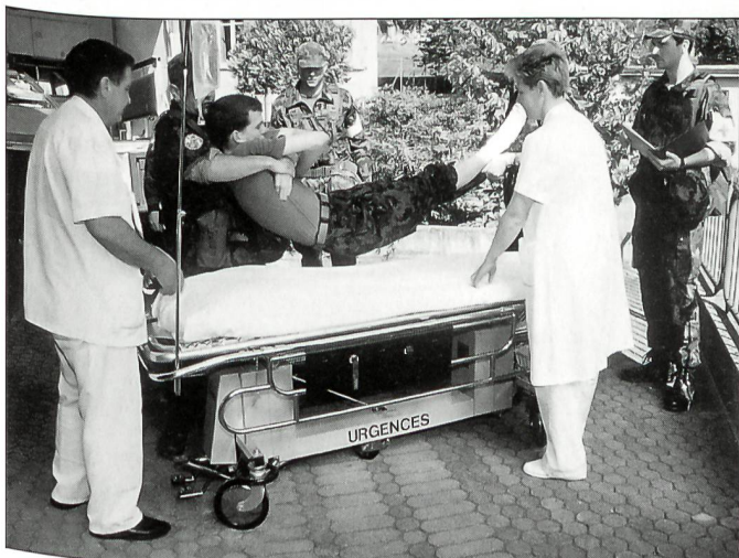
Gemeinsam wird die gemeinsam gefundene Lösung ausgeführt.