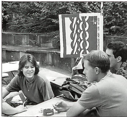
Zwischen dem Wettkampfeinsatz blieb den Teilnehmern vom UOV Grenchen auch noch Zeit für einen gemütlichen Höck.

im Einsatz stehenden 180 Funktionären waren nämlich nicht weniger als 100 Rekruten von der Elom Rekrutenschule 283 in Lyss, welche auf allen Posten und im Transportdienst eingesetzt wurden.