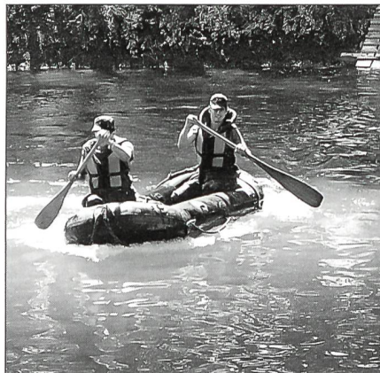
Eine ausgezeichnet harmonisierende Patrouille unterwegs auf dem anstrengenden Schlauchbootparcours.

kämpfern einen interessanten und vielseitigen Wettkampf anzubieten. Daneben sollte dieser nebst einer zeitgemässen ausserdienstlichen Ausbildung auch die neuen Ausbildungsmethoden der Armee berücksichtigen. Der KUT sollte auch wegweisend für zukünftige derartige Anlässe sein. Wichtigste Neuerung zu früheren Wettkämpfen ist, dass der Wettkampf und die Rangverkündigung am gleichen Tag stattfinden sollen. An den bisherigen Unteroffizierstagen wurden dafür immer der Samstag und Sonntag benötigt. Den Zweier-Patrouillen wurde neu die Möglichkeit geboten, aus den zehn angebotenen Disziplinen deren sieben selber auszuwählen, welche dann für die Rangierung zählten.