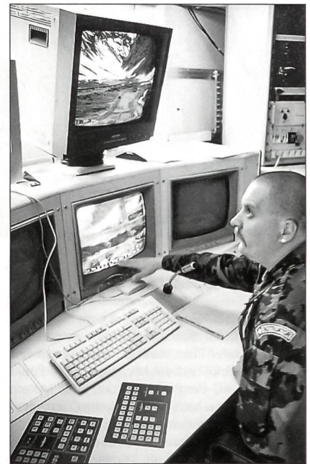
Unbestechlich überwachen die Monitore jede Bewegung der Panzerbesatzungen.

Ernst Weibel möglich, der Pz RS 22 in Hinterrhein einen Besuch abzustatten und das Schiessen mit Vollkalibermunition zu beobachten. Derweil im Mittelland frühsummerliche Temperaturen herrschten, lag auf den Bergen im Tal des Hinterrheins noch tief Schnee.