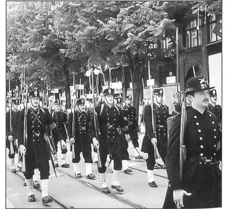
Beliebtes Fotosujet am Zürcher Erst-August-Umzug sind die «1861er» des UOV: diesmal gemeinsam mit den Klettgau-Kanoniern und Bündner Scharfschützen.

auf der Strasse verzichtet werden könne. Das gesamte Schiessplatzgelände hat eine Länge von rund neun Kilometern und eine Breite von 500 Metern; der tiefste Punkt liegt etwas mehr als 1600 Meter über Meer (an der Strasse des San Bernardino) und der höchstegelegene Punkt ist bei der SAC-Berghütte auf rund 2000 Metern über Meer. Die heutige Infrastruktur hat nach einer Bauzeit von zwei Jahren nun 15 feste und ein mobiles Panzerziel. Im neuen, modernen Übungsleitturm, der als Kommandozentrale dient, laufen alle Fäden zusammen. Mit Panzermodellen veranschaulichte Stabsadj Duppenenthaler den Gästen den Ablauf der ganzen Einsatzübung, die nur wenige Minuten dauert. Vom Leitturm aus werden die Einsätze überwacht und mit elektronischen Mitteln aufgezeichnet und sogleich ausgewertet. Die Funkgespräche der Besatzungen sind ebenso zu hören, und die Arbeit der Mannschaft, besonders jene des Geschützrichters, werden unbarmherzig mit der Videokamera verfolgt. In wenigen Sekunden erscheinen die Resultate auf dem Bildschirm, und falls notwendig, können die Auswertungen mit der Panzerbesatzung besprochen werden. Im Leitturm und viele Meter über dem Boden und hinter dicken Glasscheiben verfolgen die Altgardisten eine Einsatzübung. Ein Zug meldet sich in der Ausgangsstellung bereit, und schon