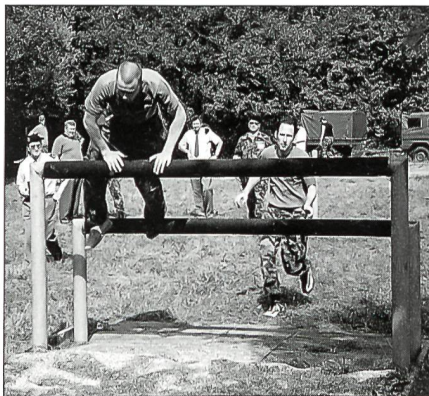
Sehr gute Kondition und Beweglichkeit verlangte die Hindernisbahn von den Wettkämpfern.