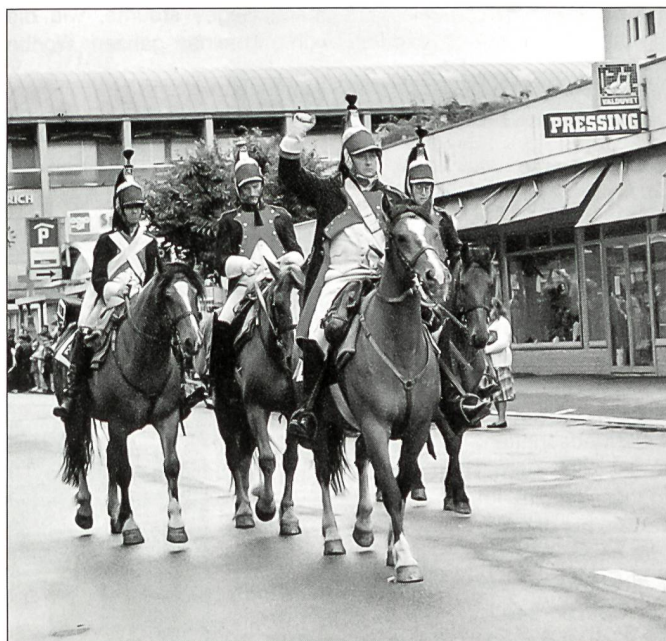
Einheiten der Grande Armée von Napoleon Bonaparte ziehen auf braven Freibergern der Armée Suisse 95 über den Grosse St. Bernhard resp. durch Martigny.

Die Kommandanten der Gebirgstruppen wissen um den unabdingbaren Nutzen des Pferdes. Stichworte: Umgehungstransporte, Begleittransporte mit Material, Grenzsicherung, Grenzüberwachung. Die Pferde garantieren die Versorgung in unwegsamem Gelände, wenn alle andern Mittel versagen. Bei ausländischen Armeen wird das Pferd wieder modern. Für die Kernaufgabe «Verteidigung und Existenzsicherung» wurden die Traineinsätze definiert. Die Aufgaben der hippomobilien Truppe werden im Bereich der Unterstützung der Truppe auch mit Armee XXI bestehen bleiben. Zahlen sind allerdings noch keine bekannt. Auch in der Katastrophenhilfe ist das Pferd oft das einzige effizient einsetzbare Mittel. Die wiehernden AdA sind in der Lage, sehr rasch und witterungsunabhängig lebenswichtige Güter nachzuschaffen oder auch Verwundetentransporte durchzuführen, wenn kein Fahrzeug mehr hin kommt und bei schlechtem Wetter kein Heli fliegen kann. Das Pferd und sein Pferdeführer ist prädestiniert, bei verschiedenartigsten Katastrophen erste Hilfe zu bringen. Durch seine Beweglichkeit und Geländetauglichkeit kann das Pferd im Schadengebiet rasch die Voraussetzungen für den Einsatz von schweren Mitteln schaffen, ohne dabei zivile Unternehmen zu