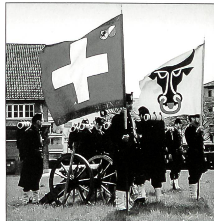
Der UOV Uri hat am diesjährigen Zürcher Sechseläuten die legendären Gotthardmanöver von 1861 dargestellt.

Der Kanton Uri war als Gast ans diesjährige Zürcher Sechseläuten eingeladen und durfte aus diesem Anlass die Spitze des grossen Festumzugs und den «Platz der Kantone» auf dem Lindenhof gestalten. Mit dabei war auch der UOV Uri, der mit der Darstellung der legendären ersten Gotthardmanöver ein militärisches Sujet in den Urner Umzugsteil brachte und an die zentrale Bedeutung des Gotthardgebietes für die schweizerische Landesverteidigung erinnerte. Unsere Umzuggruppe gliederte sich in zwei Infanteriezüge und eine Geb Art-Gruppe. Die Fahne des UOV Uri wurde begleitet von der SUOV-Zentralfahne und einem Hornisten. Bestens zu unserem Sujet passte auch die vorausrollende alte Gotthardpost mit dem letzten