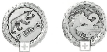
Markus Saurer und Rolf Kreuter im Glück