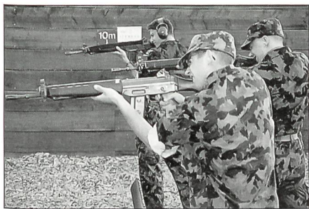
Keine einfache Aufgabe, stehend das sehr kleine Ziel zu treffen.

war. Pro falsche Antwort musste die Patrouille eine Minute Wartezeit absitzen.