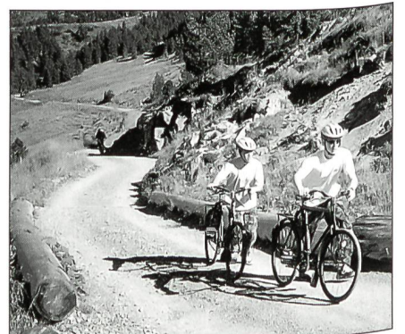
Mit letztem Einsatz dem höchsten Punkt Sewenegg entgegen, bevor es in sausender Fahrt auf der anderen Seite ins Tal ging.

Nach dem anstrengenden Geländelauf hiess es in Ober Sewen ein Militärvelo fassen und damit über die Sewenegg zur Schnabelhütte und weiter zum Glaubenbergpass zu fahren. Unterwegs auf der Velostrecke war bei der Schnabelhütte ein Zwischenhalt eingeplant, wo der Theorietest mit zehn Fragen über technische Daten von Waffen und das Allgemeinwissen zu beantworten