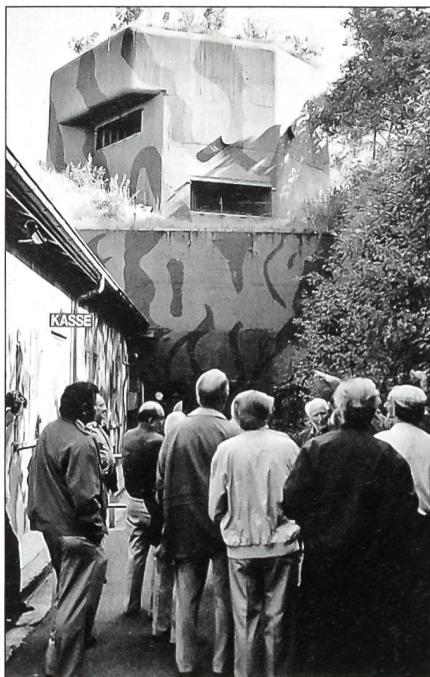
Eingang zum Artilleriewerk Reuenthal, Kurzinfo über Entstehung und Aufgabe dieser Festung.

Für den diesjährigen Veteranenausflug hatten wir uns schon seit langem den 9. August im Kalender eingetragen. Bereits um 7 Uhr trafen die ersten Veteranen auf dem Bahnhofplatz in Bern ein. Man wollte ja die Abfahrt nicht verpassen. Kurz vor 7.30 Uhr traf der «Dysli-Car» beim Busperron 3 ein. Die Teilnehmerkontrolle ergab, dass ein gemeldeter Teilnehmer nicht anwesend war. Auch per Natel konnte dieser nicht mehr erreicht werden. Somit ging die Fahrt los in Richtung Autobahn A1. Der erste Halt wurde auf dem Rastplatz unmittelbar vor der Autobahn-Ausfahrt Mägenwil eingeschaltet. Hier durften wir wie-