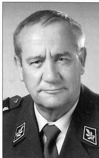
Divisionär, Kommandant der Stabs- und Kommandantenschulen seit dem 1. Januar 1996