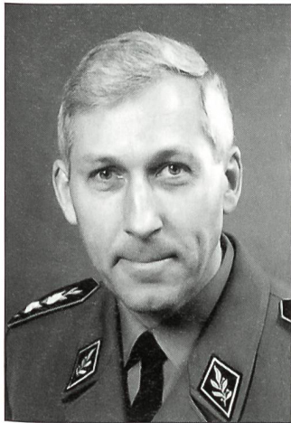
Divisionär, Unterstabschef Sanität seit dem 1. Januar 1996

offizier kommandierte er die Sanitätsabteilung 3 und das Spitalregiment 1. Dazwischen leistete er Dienst als Arzt im Infanterieregiment 13 sowie als Divisionsarzt der Felddivision 3.