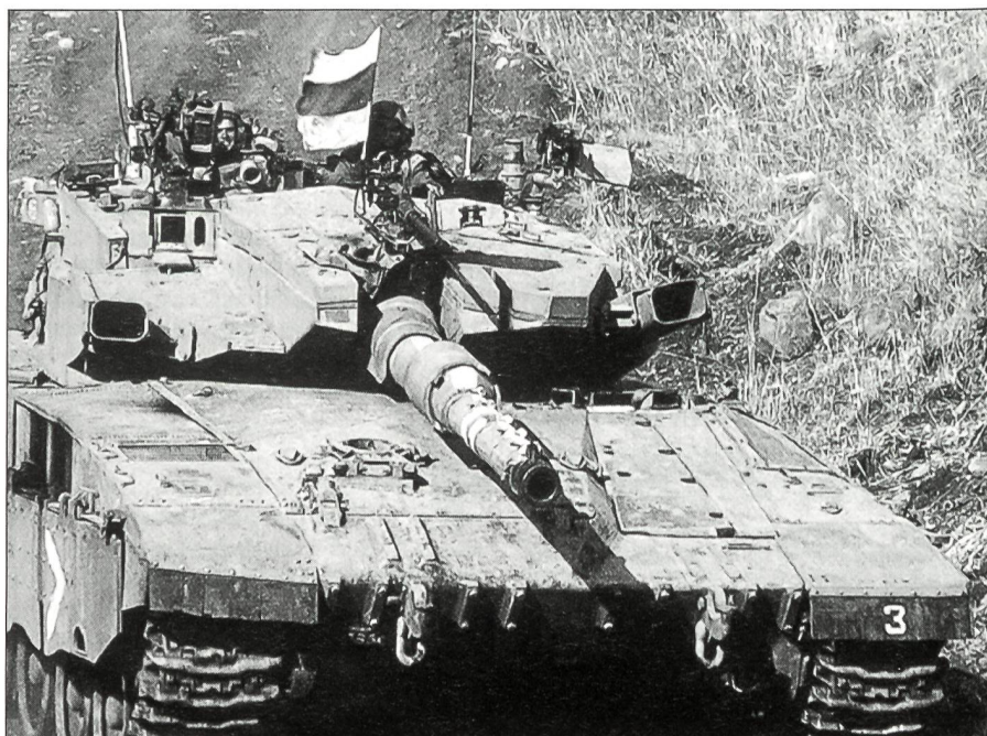
Der Merkava, Israels wichtigster Kampfpanzer.

Als tückisch empfinden israelische Offiziere den «Einsatz» von palästinensischen Kindern, die von ihren Vätern als mensch-