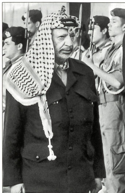
Arafat mit Ehrenkompanie.

Die militärische Schwäche liegt in den jüdischen Siedlungen im besetzten Gebiet. Politisch heiss umstritten, aber auch geschützt, belasten die Dörfer Israel militärisch. Obwohl sich die Gelehrten auch da streiten, gibt es in der israelischen Führung kritische Stimmen, welche die Siedlungen unter strategischem, operationellem und taktischem Aspekt verwünschen. Sie behindern den Friedensprozess, sie binden Truppen und können Menschenleben kosten. Die Dörfer selber müssen geschützt und die Zufahrtsstrassen offengehalten werden. Zusätzliche Aufgaben stellen sich in der Versorgung, und auch in der politisch-psychologischen Auseinandersetzung könnten sich die Siedler noch als Belastung erweisen.