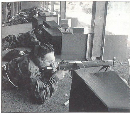
... als Schütze im Armeewettkampf beim Eidgenössischen oder bei den kantonalen Schützenfesten ...

personellen Mittel direkt zur Verfügung. Sie wirkt beratend, unterstützend und koordinierend.