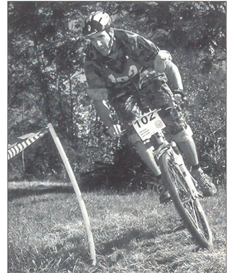
... als Radspezialist auf anstrengendem Parcours ...

Aus der Überzeugung, dass die ausserdienstliche Ausbildung jetzt wie in der Zukunft unbedingt erhalten bleiben muss, ist im FAK 4 eine solche Koordinationsstelle