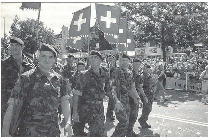
... in der Marschkolonne auf der Defilierstrecke beim Einmarsch am 4-Tage-Marsch in Nijmegen ...

AT geschaffen worden. Sie will die Verbände und Vereine im Raum des FAK 4 beraten bei der Gestaltung ihrer Jahresprogramme und der Steigerung der Attraktivität ihrer Tätigkeit. Sie will insbesondere bei Fragen der Beschaffung von Ausbildungsunterstützung, Ausbildungsinfrastruktur und Ausbildungsmaterial unterstützen und ist auch bereit, für die Koordination von Truppeneinsätzen bei Anlässen tätig zu werden zugunsten von Vereinen. Sie übernimmt aber nicht die Arbeit der Dachverbände und stellt auch keine