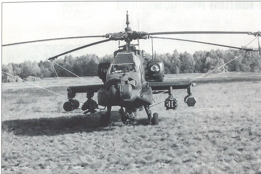
Apache, der dunkle Tarnanstrich macht es schwierig, den Hubschrauber einmal zu erkennen, wenn er im Tiefstflug über das Trainingsgelände fliegt.

dung und bin befähigt, jede Art von Einsätzen zu fliegen. In der US Army ist es so, dass wenn man in eine Einheit eingeteilt, getestet wird, um entsprechend der Beurteilung in einen Einsatzlevel eingestuft zu werden. Ich bin im Level «Eins», das ist der höchste Level.