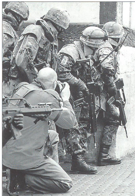
Heute ein alltägliches Bild in Kriegs- und Krisengebieten. Streitkräfte im Einsatz und an vorderster Front mit dabei: die Medien.

Konsequenz geht der Auftrag vor», erklärt Oberst Folkerts.