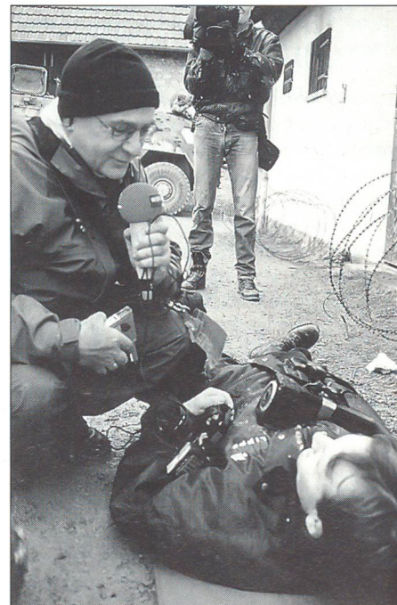
Wenn Journalisten selber zum Objekt des Medieninteresses werden. Interview mit einem während einer Übung fiktiv angeschossenen Fotojournalisten.

Die Ziele des Kurses umschreibt Ausbildungsleiter Oberst Jürgen Folkerts mit einer «Erhöhung persönlicher Sicherheit, welche zu einer erhöhten Überlebensfähigkeit» führen soll. Auch dient der Kurs dem gegenseitigen Kennenlernen. Beide Parteien sollen voneinander lernen. Trotzdem, sagt Oberst Folkerts, sei es nicht die Aufgabe der Bundeswehr, Journalisten für Einsätze in Krisen- und Kriegsgebieten auszubilden. «Ein Auge für die Story, ein Auge für die eigene Sicherheit», umschreibt er die Absicht in einem Satz. Um den Sicherheitsaspekt zusätzlich zu untermauern, erwähnt er, dass laut inoffiziellen Zahlen seit 1946 25 deutsche Journalisten in Krisen- und Kriegsgebieten ums Leben