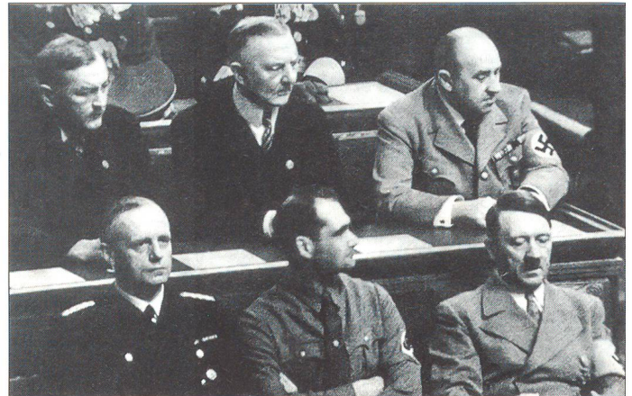
Zu nahe beim falschen Mann – Mitte oben Schacht, unten rechts Hitler.

Kiel zum Doktor der Philosophie. Seine Laufbahn begann in den statistischen Büros der Dresdner Bank. Er hatte sich um eine unbedeutende Stelle als Sachbearbeiter beworben und sie erhalten. Für sein ganzes Leben war es das einzige Mal, dass er sich beworben hatte. Von nun an wurde durch alle Zeiten und auch die Wirren des Zweiten Weltkrieges hindurch bis lange danach nur noch um ihn geworben.