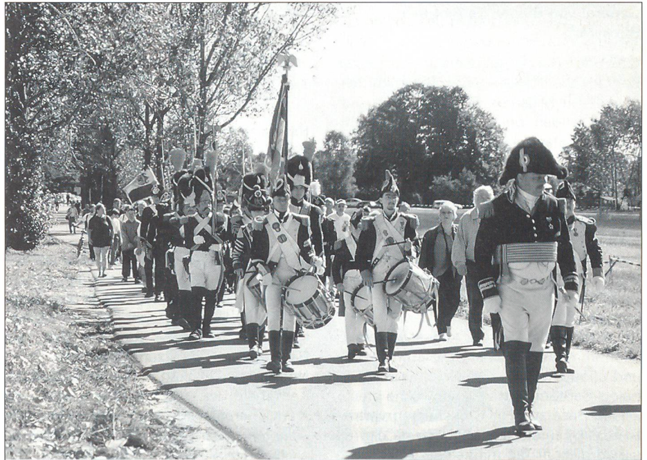
Aufmarsch der Alten Garde Napoleons.

Die Tradition des Siegesfestes in Grossbeeren nahm vor allem seit der Wiedervereinigung Deutschlands einen grossen Aufschwung. Seit 1990 strömen jährlich Tausende von Besuchern am Wochenende des Schlachtentages nach Grossbeeren. In einem historischen Biwak versammeln