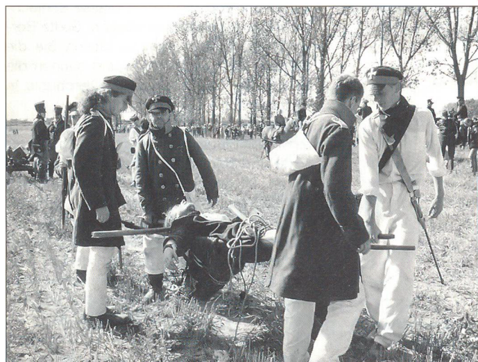
«Verwundetentransport» während der Gefechtsnachstellung.

Literatur: Frank Bauer, Grossbeeren 1813. Die Verteidigung der preussischen Hauptstadt, 2. Aufl., Berg-Potsdam 1998, Grossformat, 116 S., 60 Farb- und 56 s/w-Abb., 9 farbige Kartenskizzen, DM 36.– (ISBN 3-921-655-81-X)