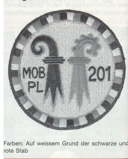
Farben: Auf weissem Grund der schwarze und rote Stab