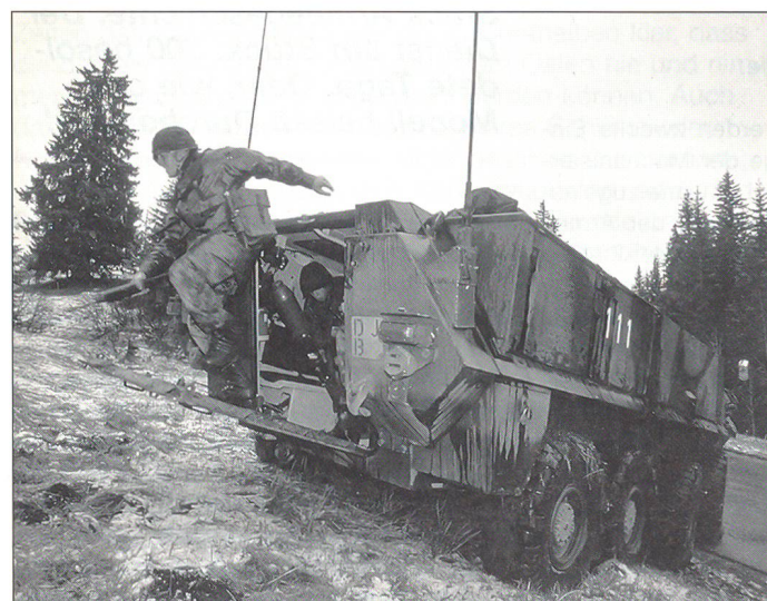
Aus der Grundausbildung der Durchdiener-RS: Kameradenhilfe, Sanitätsdienst; Theorie und Praxis mit dem Sturmgewehr 90; Übungen in der Gruppe; Nahkampf Ausbildung; Ausbildung am Radschützenpanzer oder als Fahrer auf leichten oder schweren Lastwagen.

Dousse ist es ein Anliegen, dass sich potenzielle Interessenten für die neue Kategorie von Dienstleistung damit vertraut machen und auseinander setzen können. Er zeigte sich aber zuversichtlich, dass sich die gemäss den heutigen Eckwerten benötigten 3000 Durchdiener für die Armee XXI ohne grössere Schwierigkeiten finden lassen.