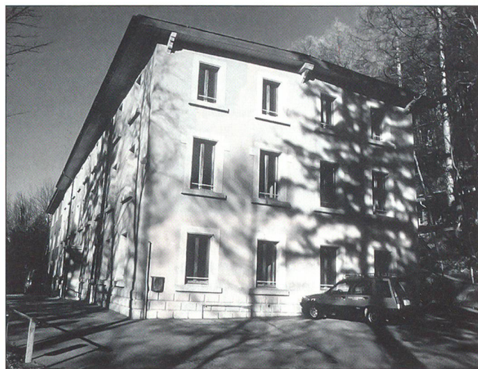
Eine der Kasernen in Savatan (Waffenplatz St-Maurice/Lavey).

mandant Douce. Der Sicherheitspolitische Bericht 2000 sowie die Politischen Leitlinien des Bundesrates sehen nämlich vor, dass für die Armee XXI neue Dienstleistungsmodelle geschaffen werden müssen.» Ein Modell, jenes des Zeitsoldaten, sei bereits seit Juli 1999 am Laufen; mit dem zweiten, dem Durchdiener, werde nun gestartet. Ziel sei es, beide Modelle fließend in die Armee XXI überführen zu können – als definitive Dienstleistungsmodelle, so der Chef Heer vor den Medien in Bern.