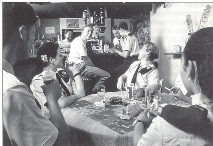
Am Abend bleibt auch in der Durchdiener-RS für Ausgang, Sport und persönliche Weiterbildung Zeit.

So müssen mit 300 Diensttagen zwar 20 Tage mehr geleistet werden als in der Armee XXI, doch besteht das Anrecht auf 20 Tage Urlaub. Zudem sind 3 von 5 Abenden dienstfrei, und der Wochenendurlaub beginnt bereits am Freitagabend. Für die Freizeitgestaltung werden den Durchdienern auch Sprach- und Computerkurse,