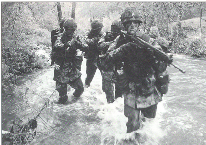
Auch die militärische Grundausbildung wird gegenwärtig analysiert. Veränderungen liegen auf der Hand. Die RS in der Armee XXI wird länger sein als heute.