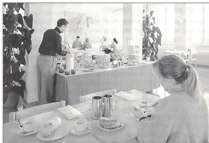
Speisesaal mit moderner Ambiance.

Zusammen mit den Ärzten und den Physiotherapeuten ist der Pflegedienst ein wichtiger Teil des Rehabilitationsteams der Klinik.