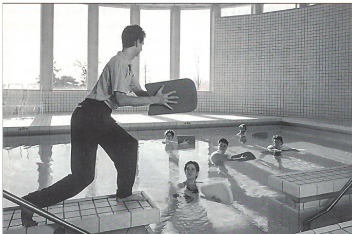
Engagierter Therapeut mit Patienten bei der Gruppentherapie im Hallenbad.

sich bei den Patienten grosser Beliebtheit. Die Teilnahme hängt von der Beschwerdeintensität und der Belastbarkeit ab. Unter Anleitung des Fachpersonals ist es auch Nichtschwimmern problemlos möglich, bei der Wassertherapie mitzumachen. Der positive Effekt des Wassers auf Gelenke und Rücken ist wohlbekannt. Ferner wirkt sich jede Gruppenaktivität stimulierend auf den Einzelnen aus. Die Klinik verfügt über zwei Therapiebäder, nämlich ein beheiztes, mit einer Hebebühne für behinderte Patienten ausgestattetes Hallenbad mit einer Wassertemperatur von 33 °C sowie ein Freibad, welches im Sommer benutzt werden kann.