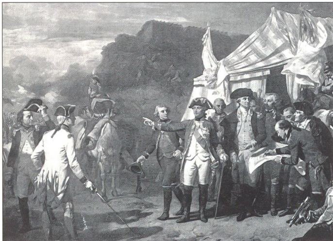
Die Einnahme von Yorktown am 17. Oktober 1781. Gemälde von Auguste Couder. In der Mitte der Sieger Washington. Rechts von ihm Rochambeau, der das französische Hilfskorps geführt hatte. Halblinks hinter ihm Lafayette. Bei der Kapitulation von Yorktown geriet ein britisches Korps von 7000 Mann in Gefangenschaft.

kunst in der amerikanischen Wildnis vorzugehen. Da warnte ihn Washington vor der völlig anderen Situation und Unberechenbarkeit der französisch-indianischen Verbände. Braddock schlug die Warnung in den Wind. Und schon war es zu spät. Er geriet mit seinen Truppen in einen Hinterhalt und wurde aufgerieben. Washington aber feuerte die letzten überlebenden Soldaten ohne jegliche Schonung seiner selbst zum äussersten Widerstand an, harrete stundenlang an der Seite des tödlich getroffenen, sterbenden Generals aus und bezog mit den Resten des Expeditionskorps sichere Auffangstellungen. Die Berichte über seinen heldenhaften Einsatz in der Schlacht machten Washington mit einem Schlag über die Grenzen Virginias hinaus berühmt und angesehen. Dinwiddie ernannte ihn abermals zum Obersten.