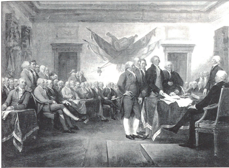
Unterzeichnung der amerikanischen Unabhängigkeitserklärung. Gemälde von John Trumbull (1756 – 1843). Thomas Jefferson überreicht im Namen des mit der Ausarbeitung beauftragten Ausschusses den Entwurf der Unabhängigkeitserklärung. Rechts neben ihm Benjamin Franklin.

geschaffenen USA sind ihrem ersten Präsidenten so wenig vertraut wie einst das Heer, dessen Oberkommandierender er geworden war. Er brachte wenig politische Erfahrung mit ins Amt. Erstmals sollten die neuen Theorien der Gewaltenteilung verwirklicht werden.