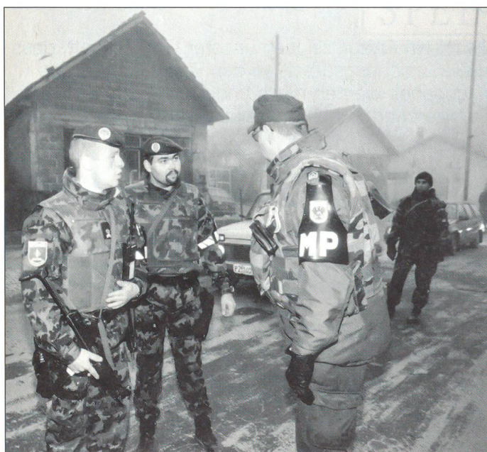
Angehörige der Schweizer Armee leisten seit 1999 im kriegszerstörten Kosovo Wiederaufbauarbeit. Bild: zwei Schweizer und ein österreichischer Militärpolizist.

Ich bin militärischer Chef und gelernter Jurist. Als militärischer Chef sage ich: Die Waffe gehört zur persönlichen Ausrüstung jedes Soldaten, in jeder Armee. Als Jurist sage ich: Die Waffe ist nötig für den legitimen Selbstschutz. Doch die höchste Verantwortung eines Chefs – noch vor jedem