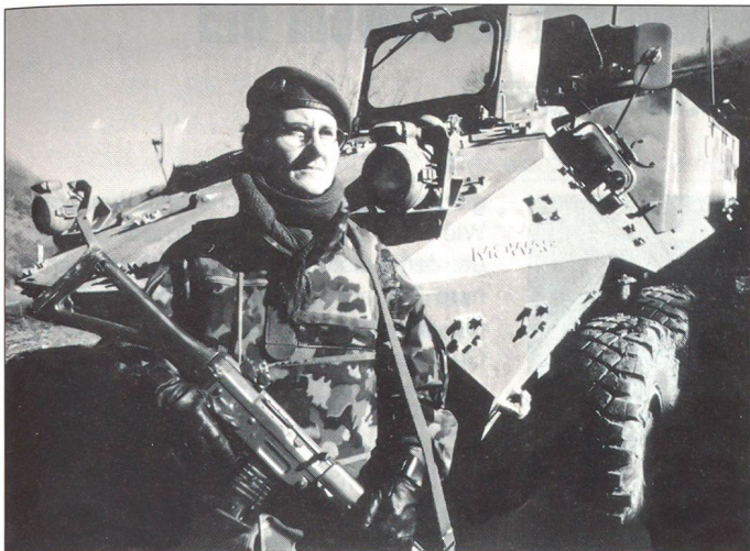
In der Swisscoy-Truppe im Kosovo zählt man regelmässig fünf bis neun Frauen. Hier: Eine Angehörige des Sicherheitsmoduls, welche im zivilen Leben als Festungswächterin arbeitet.

zu erfüllenden Auftrag – ist das Leben seiner Unterstellten. Einen Menschen zu verlieren ist tragisch. Einen Menschen zu verlieren, der sich in einem Krisengebiet nicht verteidigen konnte, ist absolut tragisch. Sowas könnte ich als Chef mit meinem Gewissen nicht vereinbaren. In der Schweiz, in unseren Dörfern, bewachen unsere Soldaten und Truppen ihre Unterkünfte und Fahrzeuge – bewaffnet, im Wachtdienst mit Kampfmunition. Und im Kosovo, wo hinter jeder Hausecke Gefahren lauern, sollen unsere freiwilligen Friedenssoldaten dann unbewaffnet sein? Das geht doch nicht auf!