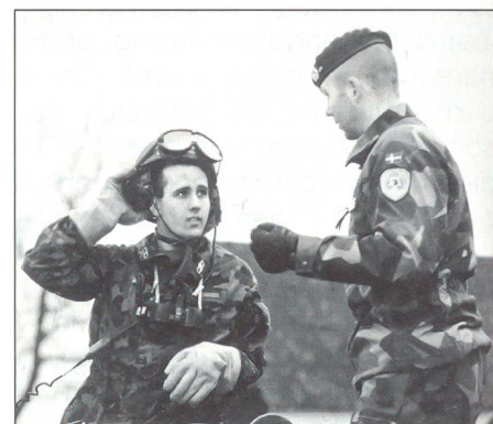
Ein schweizerischer und ein schwedischer Angehöriger der Panzertruppen auf schwedischem Übungsgelände.

Im Gegenteil: Diese Rechnung geht absolut auf! Revinge in Schweden beispielsweise ist ein riesiges Panzergelände – rund zehn Mal grösser als jenes von Bure. Breites, tiefes und unbekanntes Gelände. Wenn wir Schweizer dort oben trainieren können, 1:1 mit Kampfpanzern, ist das für jeden Soldaten und Kader eine grosse Herausforderung. Es ist Training ab verstärkter Kompanie aufwärts! Als Gegenleistung können die Schweden unsere Simulatoren in Thun benutzen – das macht Sinn. So sind unsere Hightechanlagen bestmöglichst ausgelastet. Zu Ihrer Beruhigung: Die Zusammenarbeit zwischen der Schweiz