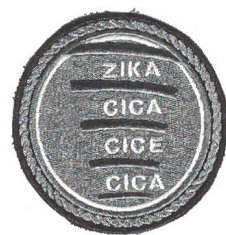
Badge des Zentrums für Information und Kommunikation der Armee.

chen. Zusammenhänge werden hinterfragt und Vorgesetzte mit zum Teil sehr subtilen Methoden auf ihre Tauglichkeit als solche getestet. Altersvorsprung und Dienstgrad können da schnell auf der Strecke bleiben. Dies erst recht, seit der Trend auch in der Armee hin zu kleinen, schlanken, so genannten verflachten Führungsstrukturen sich zu etablieren beginnt.