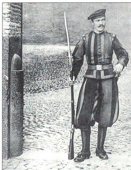
Wache am Posten «Zecca» um 1900 – Das veraltete Remington-Gewehr Mod. 1868 wurde 1911 durch das deutsche Mauser-Gewehr Mod. 1898 ersetzt.

Mehr zu diesem Thema erfahren Sie aus dem Buch «Vom Remington zum Sturmgewehr 90 – Die Schusswaffen der Päpstlichen Schweizergarde», zirka 200 Seiten, zahlreiche Abbildungen und Dokumente, Preis zirka 40 Franken. Vorbestellungen nimmt gerne entgegen: Thesis Verlag GmbH, 8847 Egg SZ. ☒