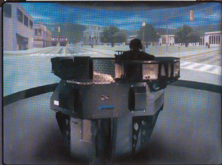
Projekt CCS KONGSBERG, SINTRO