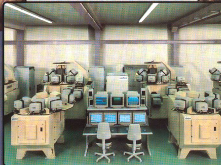
Projekt TOS SINTRO, SE