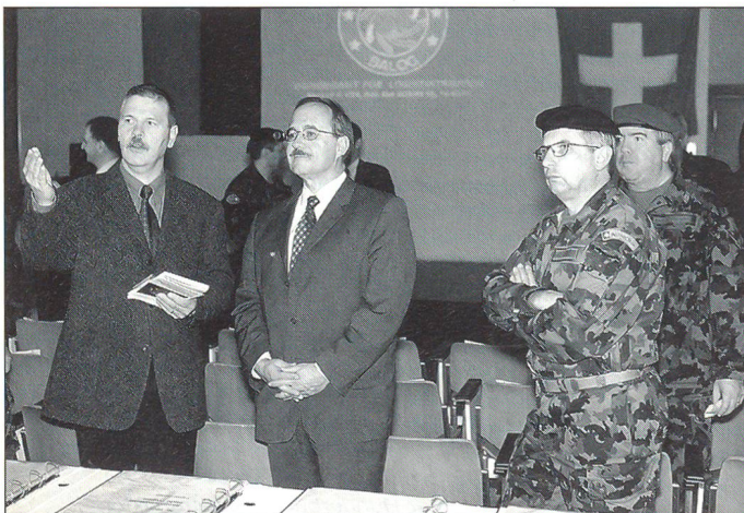
Der Chef VBS lässt sich gerne klar und umfassend informieren.

In der Schweiz können nicht mehr alle Übungen durchgeführt werden, die es braucht, um den nötigen Ausbildungsstand für den Verteidigungsauftrag zu erreichen und zu halten. Solche Übungen sind aber für das Milizkader als grosser Anreiz sowie als Erfahrungstransfer von wesentlicher Bedeutung. In der Luftwaffe und bei den Mechanisierten Verbänden können