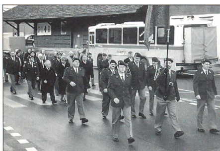
Gäste und Delegierte marschieren gemeinsam an die Delegiertenversammlung im Pfarreiheim Schüpfpheim.