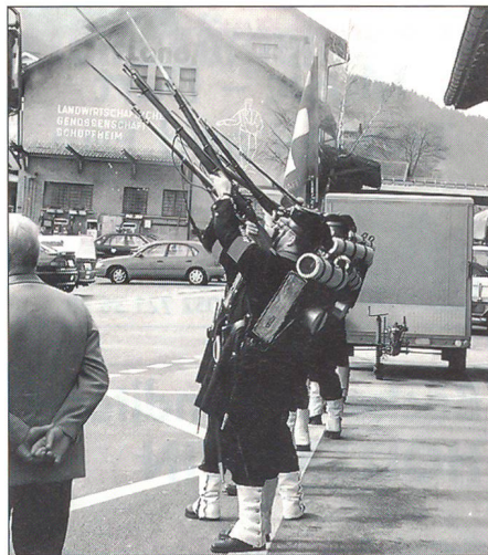
Mit einem Salutschiesen begrüsste die Zürcher Miliz-Compagnie 1861 die Delegierten und Gäste.