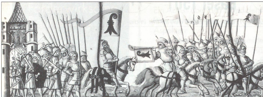
Auszug bewaffneter Basler Bürger aus dem Spalentor.

Für Basel stand damals viel auf dem Spiel. Die grossen Besitztümer im habsburgischen Sundgau und Breisgau, welche zur Versorgung der Stadt und der eidgenössischen Orte genutzt wurden, waren in Gefahr verloren zu gehen, wenn sich Basel in den Kampf einmischte. Die Eidgenossen hatten mit ihrem selbstmörderischen Opfergang nicht nur Basel, sondern letztlich die Eidgenossen gerettet. Basels Beziehung zur Eidgenossenschaft wurde durch dieses Ereignis stark beeinflusst und geprägt.