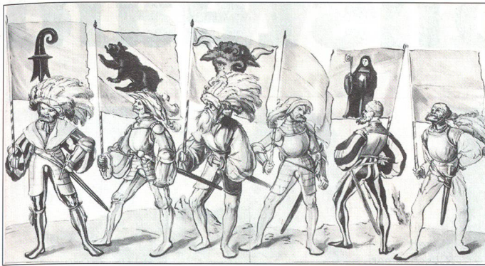
Bannerträger der Alten Orte der Eidgenossenschaft.

ihre militärische Stärke durch die entscheidenden Siege an der Calven im bündnerischen Münstertal, im vorarlbergischen Frastanz, vor den Toren der Stadt Konstanz (bei Schwaderloh) auf dem Basler Bruderholz und in der Schlacht bei Dornach 1499.