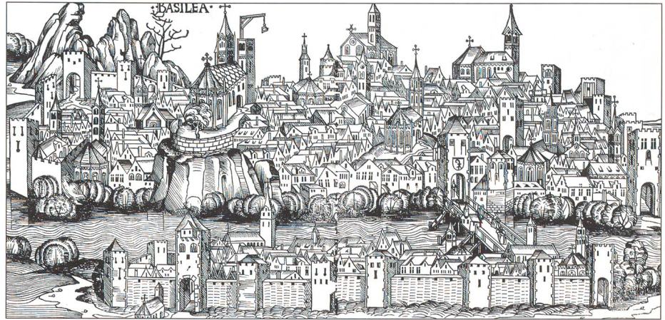
Ansicht der Stadt Basel 1493, Blatt CCXLIII Basel.

Eine 500-jährige Erfolgsgeschichte nimmt so ihren Anfang.