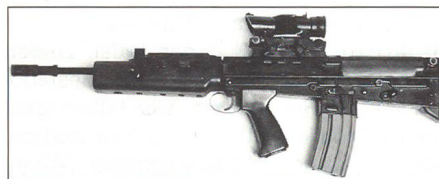
Enfield SA 80 (L 85 A 1)

pn. Die Hauptbewaffnung des Soldaten stellt in der Regel immer noch das Sturmgewehr dar. Mit ihm kann der Feuerkampf gegen einen ungepanzerten Gegner bis auf eine Distanz von 200 bis 300 m geführt werden. In der NATO und im westlichen Europa stellt das Kaliber 5,56×45 mm den Standard dar, während die Kalashnikov das Kaliber 5,45×39,5 mm verschießt. Neben dem uns bestens bekannten Stgw 90 werden im kommenden Quiz die folgenden Waffen behandelt: