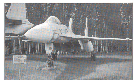
Eine Suchoi-27 in der Gagarin-Akademie.

Als Krisensymptome nannte Fedorow: die schlechte Moral und Disziplin der Truppe,