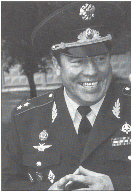
Generalleutnant Naidjanow, stellvertretender Kommandant der Luftwaffen-Akademie.

politischen Führung der Gorbatschow- und Jelzin-Jahre.