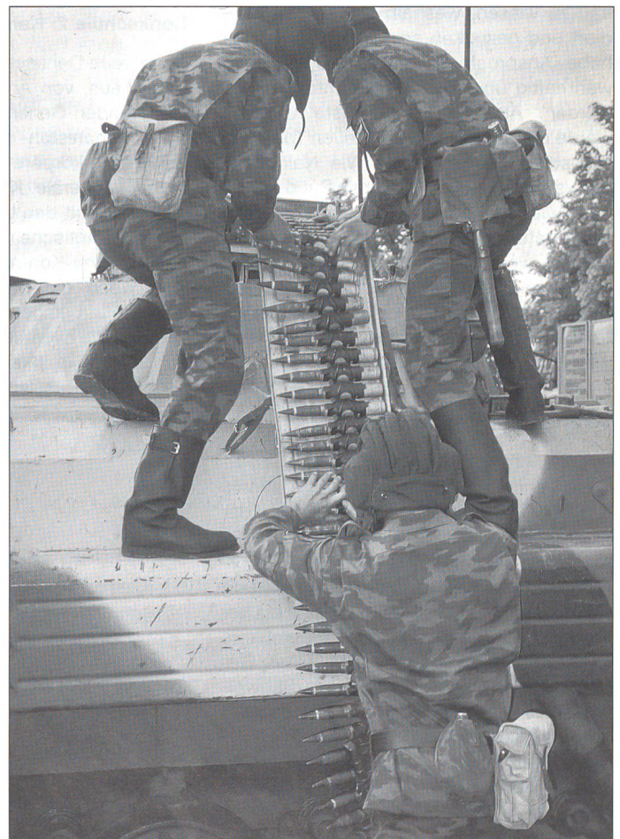
Panzergrenadiere der 27. Infanterie-Brigade.

Ein differenziertes Bild entwarf in St. Petersburg Vizeadmiral Nikita Sakurin. Er empfing die Schweizer Abordnung in den stilvollen Räumen der Kusnetsow-Marine-Akademie. In einem gehaltvollen Referat gestand Sakurin ein, die russische Flotte sehe sich gegenwärtig auf ihren Einsatz als Küstenmarine zurückgeworfen. Ihr Hauptauftrag laute, am Pazifik, im Nordmeer, an der Ostsee und im Schwarzen Meer die weitläufigen Küsten des Landes einigermaßen zu schützen. Auch Sakurin, seines Zeichens stellvertretender Kommandant der Marine-Akademie, übte Kritik an der