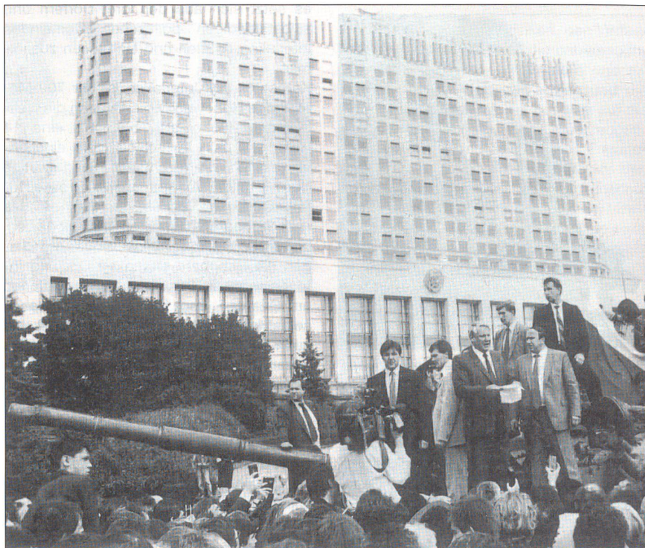
Niemand scheint damit gerechnet zu haben, dass Gorbatschows alter Widersacher Jelzin den Putschisten entgegengetreten würde.

Auf einmal reiben sich die Strassenbauarbeiter verdutzt die Augen. In hektischer Folge kreuzt Dienstwagen um Dienstwagen auf. Soldaten rennen mit Maschinenpistolen herum. Es kommt zu Wortgefechten: Den Arbeitern wird der Teer kalt. Schlagartig hat sich der morgendliche Alltag ver-