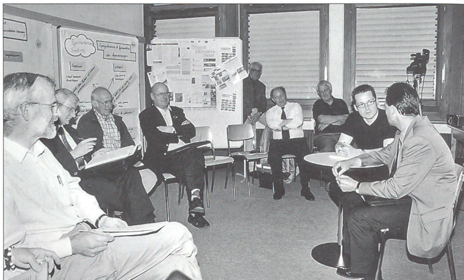
Das Interview im Massstab 1:1 wird von den Gruppenangehörigen interessiert verfolgt.

fanden die Autofahrer den Weg, die Bahnenbenutzer taten sich schon schwerer. Den Regionalzug nach Lattigen fanden zwar alle, aber dass man bei der gewünschten Station auf den Halteknopf hätte drücken sollen, hat niemand gemerkt. Erst nach einem längeren Fussmarsch «zurück» erreichte die Gruppe das AC-Zentrum.