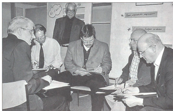
Man ist sich einig: Der Fragenkatalog für das Interview wird zu Papier gebracht.