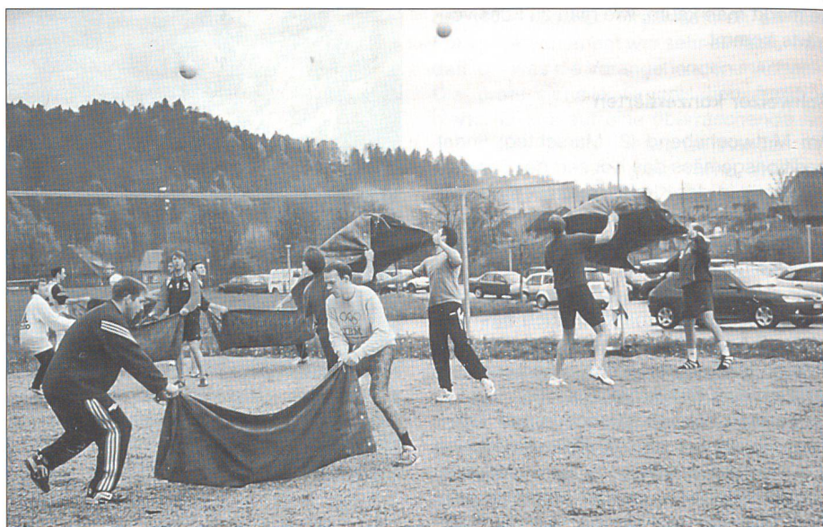
Klasse A. Käser, Variante Ausbildung Beachvolleyball

Was ist ein Sportchef, ein Sportleiter? Neben einem Sportchef sind mindestens zwei Sportleiter die Fachspezialisten für alle sportlichen Aktivitäten in einer Einheit und damit die rechte Hand des Kommandanten. Zusätzlich zur Fachausbildung im WK sollen auch die sportlichen Aktivitäten nicht zu kurz kommen. Diese helfen letztlich, die Kondition und die Konzentration der AdA zu fördern und dienen nicht zuletzt der Kameradschaft. Damit Sportchef