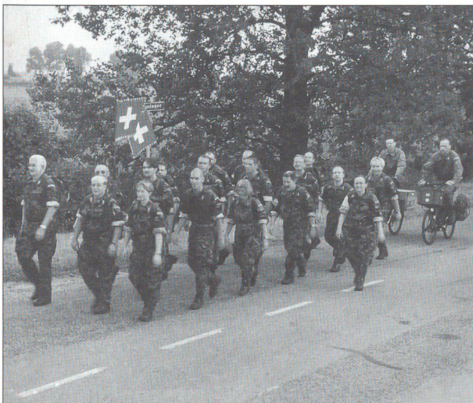
1. Marschtag: gesamte Marschgruppe Interlaken inkl. die beiden Betreuer auf Velo.

Wenn man sich entschliesst, am 4-Daagse teilzunehmen, beginnt das «Abenteuer» eigentlich schon Ende Winter vorher. Gilt es doch, sich selber und eine ganze Gruppe darauf vorzubereiten. Für die Gruppenleitenden bedeutet dies viel Arbeit. Nicht nur die Trainings müssen organisiert werden, auch die Reise und vor allem die Unterstützung und Betreuung der Teilnehmenden. Im Verlaufe des Frühlings stossen laufend neue Personen zur Gruppe und wiederum andere stellen fest, dass es dieses Jahr doch nicht reicht. Es ist oft bis zuletzt fast ein Pokerspiel, wie viele Personen die Gruppe wirklich umfassen wird. Einige Zeit in der Vorbereitungsphase muss oft für die Suche nach einem geeigneten Betreuer verwendet werden. Wir hatten Glück und fanden schliesslich auch zwei Personen, welche sich bereit erklärten, die Gruppe an den 4 Tage, auf dem Velo zu begleiten. In Holland ist man sowohl als Marschteilnehmende als auch