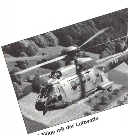
Heli-Flüge mit der Luftwaffe