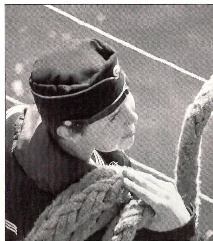
Schiff ahoi, ein weiblicher Matrose bei der Arbeit.

Nach der militärischen Ausbildung können Frauen wie Männer in den Aktivdienst eingezogen werden, wenn die militärische Bedrohung dies erfordert. Alle bleiben bis zu dem Jahr in der Reserve eingeteilt, in dem sie das 60. Altersjahr erreichen.