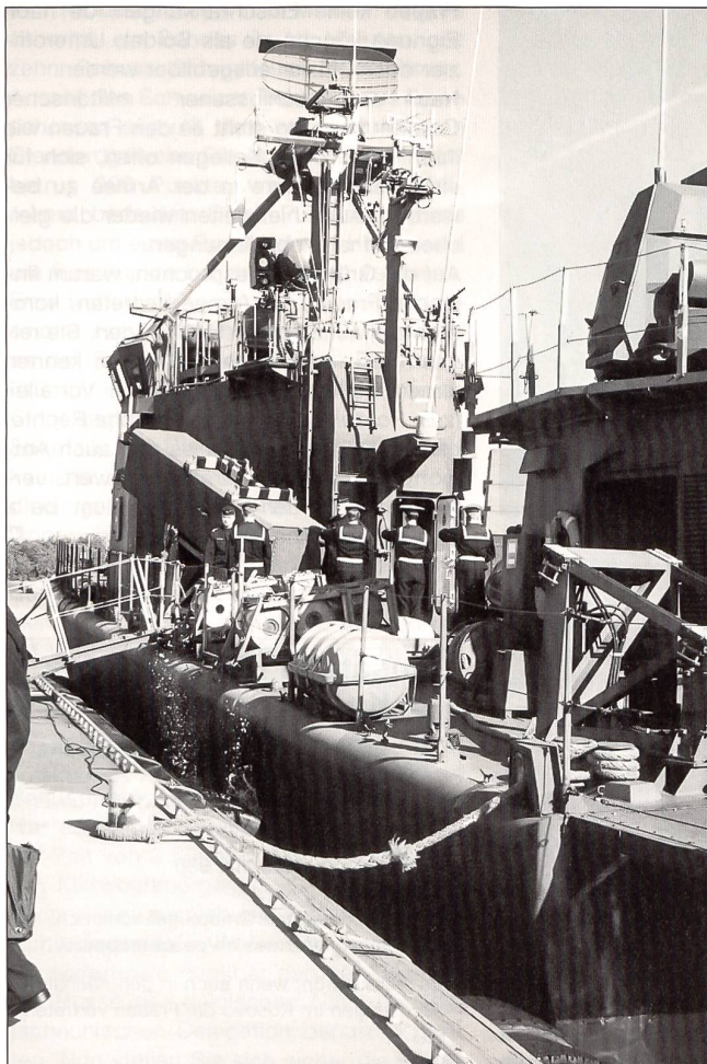
Auch auf solchen Schiffen können Frauen in Finnland Dienst leisten.