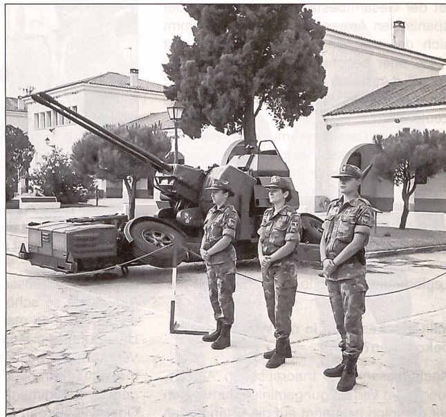
Dreifache Frauenpower neben dem Geschütz.

Am nächsten Morgen ging es dann los. Die Fahrt führte uns zum spanischen Verteidigungsministerium. Anlässlich des dortigen Gesprächs merkten wir rasch, dass wir einen spannenden Zeitpunkt für unseren Spanienbesuch ausgewählt hatten: Auf Anfang 2002 wechselt die spanische Armee nämlich zu einer reinen Berufsarmee über. Waren bis anhin nur Offiziere und Unteroffiziere Berufssoldaten, werden es ab nächstem Jahr alle Mannschaftsgrade